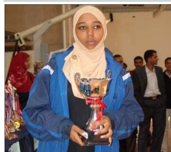
ندي احمد هادي

بتوجيهاته تم الاهتمام بالبنية التحتية لجميع الالعاب الرياضية، وحقيقة منذ تحقيق الوحدة المباركة تطورت الرياضة في بلدنا الى الأفضل واستطاعت ان تحصل الى المستوى الدولي وتحقق المراكز الاولى وتحصد الميداليات الذهبية ، وعلى سبيل المثال لعبة الجودو والكونغ فو وكرة القدم عكس الوضع قبل الوحدة الذي فيها المشاركات محدودة والانجازات تكاد تكون معدومة وخاصة في الالعاب الفردية . واصبح اليوم للرياضة النسوية اليمنية شأن كبير من خلال الاهتمام بمختلف الالعاب الرياضية واقامة المسابقات المستمرة وحتى المشاركات الخارجية والرياضة النسوية اليوم تنظى بالاهتمام والرعاية من قبل القيادة السياسية ووزارة الشباب والرياضة .