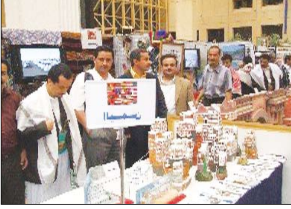
جانب من جناح اليمن في معرض تراث الشعوب