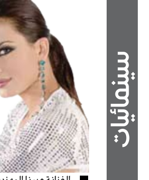
الفنانة ميرنا المهندس