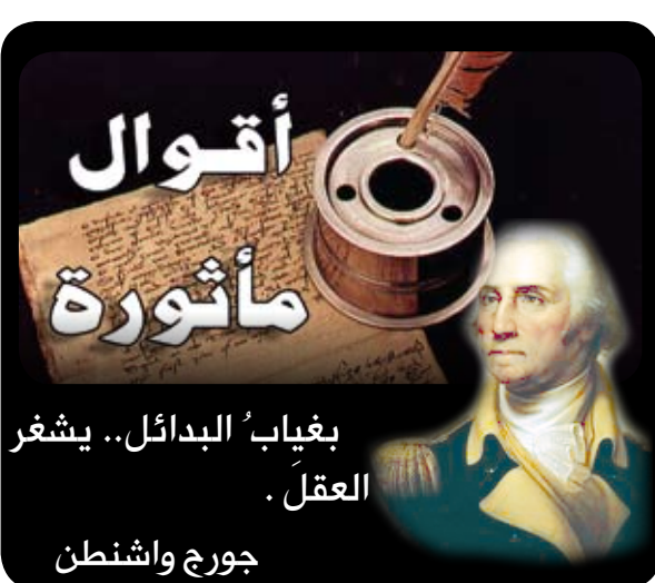
بغيب البدائل.. يشغر العقل