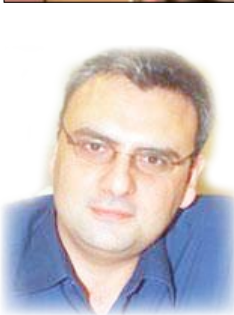
الشاعر اللبناني /كامل فرحان