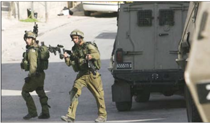
قوات اسرائيلية تقتحم جنين

فلسطين المحتلة/ وكالات: اقتحمت قوات الاحتلال الإسرائيلي فجر أمس مدينة ومخيم جنين شمال الضفة الغربية، وجابت الأليات العسكرية شوارع في المدينة وأزقة في المخيم وسط إطلاق نار كثيف. وأفادت مصادر أمنية فلسطينية وشهود عيان بأن القوة المقتحمة انسحبت في وقت لاحق، ولم يبلغ عن اعتقالات. وبموازاة ذلك اعتقل الجيش الإسرائيلي فلسطينيا فجر أمس عندما كان يحاول اجتياز السياج الأمني الفاصل في جنين. وأشارت الإذاعة الإسرائيلية أن الفلسطينيين عثر بحوزته على سكين، موضحة أنه أحيل إلى أجهزة الأمن للتحقيق معه. وفي الخليل أزيلت قوات الاحتلال حاجزا مهما أقام منذ ثمانية أعوام على طريق قرب الخليل جنوبي الضفة، كما أخلت مستوطنة عشوائية في مدينة نابلس واعتقلت عددا من المستوطنين الذين كانوا يعارضون عمليات الإخلاء. وتزامن ذلك بدء قوى الأمن الفلسطينية تنفيذ حملة أمنية واسعة النطاق في محافظة طوباس شمال الضفة يقول المسؤولون إن هدفها معالجة كل الأمور التي تتعارض مع القانون والنظام العام. في هذه الأثناء أعلن متحدث باسم الجيش الإسرائيلي أن صاروخا أطلق