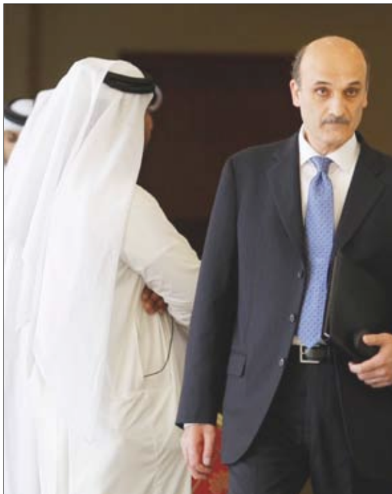
جانب من الزعماء اللبناني في الدوحة

اليوم الاثنين الرئيس المصري حسني مبارك في شرم الشيخ على هامش مؤتمر اقتصادي دولي. وقالت الوزارة إن اللقاء سينتاول خصوصا مناقشات تجريبها مصر مع حركة حماس بحثا عن هدنة بين إسرائيل وحماس. وفي السباق سيلتقي الوزير إيهود باراك سيلتقي