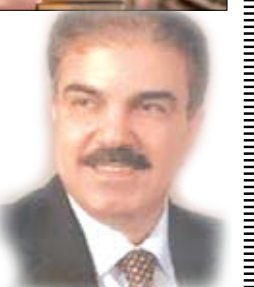
الشاعر العراقي / مفاد الرحيم

الماء في درجة صفر 0,9999. ويتبع هذا التغير في الكثافة مع تغير من الأجزاء المكونة من الماء، وتكون أسوأ كلما كان السائل أكثر سيولة. * يعتبر الخازن من أوائل أعلام الحضارة العربية الإسلامية الذين بحثوا في الجاذبية وأضافوا إليها إضافات لم يعرفها الذين سبقوه، وقال إن التناقل والتجاذب قواه إلى مركز الأرض دائماً، وأظهر العلاقة بين سرعة الجسم والمسافة التي يقطعها الزمن الذي يستغرقه قبل غاييلو بخمسة قرون. ويقول: إن هناك قوة جاذبية على جميع جزئيات الجسم وإن هذه القوة هي التي تبين صفة الأجسام، وقد ثبت حديثاً بأن لهذه النظرية أهمية قصوى في عمليات التحليل الكيميائي.