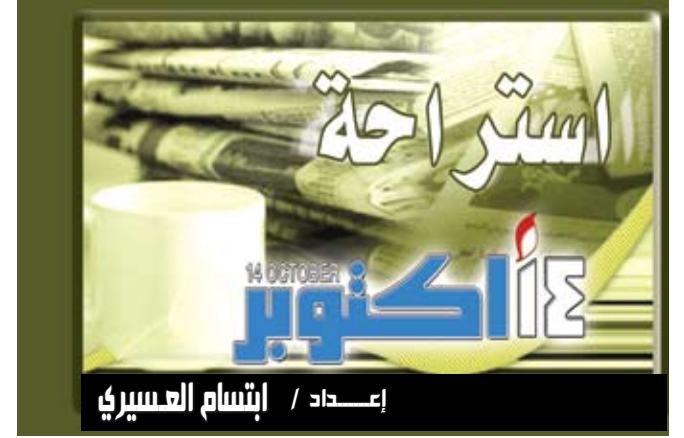
إعداد / إنشام العسيري

تبدو للوهلة الأولى وكأنها دفتر لتدوين الملاحظات إنما وعلى عكس دفتر التدوين الكلاسيكي، يمكننا عن طريقها الكتابة مباشرة على شاشة الكمبيوتر. هذا ما تعرضه تكنولوجيا جديدة في الأسواق، بأسعار مقبولة. وتتمثل هذه التكنولوجيا بمنهج يدعى (Oxford Easybook M3) وهو عبارة عن دفتر رقمي طورته شركة (Hamelin Paperbrands) ويحوي نوعاً من الأوراق الرقمية التي تعتمد على تكنولوجيا طورتها مجموعة تدعى "أوتو" تتألف كل ورقة رقمية من مصفوفة (جدول مقسم إلى خلايا أو خانقات) لرصد حركة اليد عن طريق قلم خاص مجهز بكاميرا فيديو صغيرة الحجم تعمل بالأشعة تحت الحمراء. وأثناء الكتابة، يتم تسجيل كلمات الرسالة