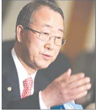
بان كي مون