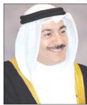
وزير الإعلام البحريني

السياحية ما يؤهلها إلى الرهان على هذا القطاع ليكون داعمًا للدخل القومي كما أننا مؤمنون بان هدفنا الأول من هذه السياحة هم أبناء البلد لذا فإننا سنهتم في قاعدة البيانات التي نرغب في أن نمتلكها لخدمة القطاع السياحي اهتماماً وافياً بالسائح. وقال وزير الإعلام إن الرحلة السياحية لأي فرد أو عائلة هي عبارة عن تغيير الأوجاء وطبيعة قضاء الناس ليومهم لذا فإننا سنعمل على إيجاد برامج توفر هذا الشعور للناس من داخل البحرين وخارجها مما يضمن لنا سياحاً دائمين وليس موسميين نتيجة لظروف المتغيرة الحارة. تجدر الإشارة إلى أن مستشار منظمة السياحة العالمية سيعد تقريراً خاصاً عن مملكة البحرين وعن مدى إمكانية تطبيق الأنظمة المعلوماتية الحديثة للعمل السياحي التي تأتي في مقدمتها قاعدة البيانات لتصبح البحرين بعد ذلك النموذج الأهم لاستخدام الأنظمة المعلوماتية في القطاع السياحي في المنطقة.