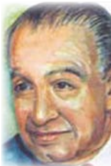
أبو ريشة شاعر أصيل