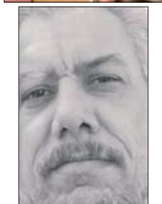
الشاعر العراقي / وديع العبيدي

وعندما نغفو على أعقابنا نتعب أو.. نسقط في غفلة تأخذنا الدنيا كما لو أنها لا تعرف مثل بقايا عصف.. تلقى بنا.. فوق رصيف تائه..