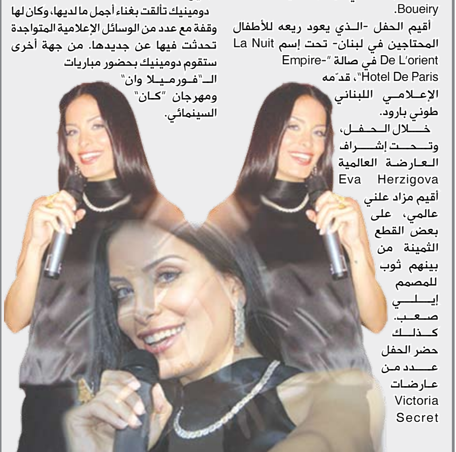
أقيم مزاد علني عالمي، على بعض القطع الثمينة من بينهم ثوب للمصمم إيلي صعب، كذلك حضر الحفل عدد من عارضات Victoria Secret

بيروت / منبأيات : بحضور حشد إعلامي، وشخصيات اجتماعية عالمية مرموقة على رأسهم Prince Albert De Monaco ، أحيت النجمة دومينيك حوراني حفلا خيريًا في Monaco أقامته جمعية Borne Boudairy ، التي ترأسها السيدة Borne Boudairy ، الذي يعود ريعه للأطفال المحتاجين في لبنان- تحت إسم La Nuit De L'orient "Hotel De Paris"، قدمه الإعلامي اللبناني طوني بارود.