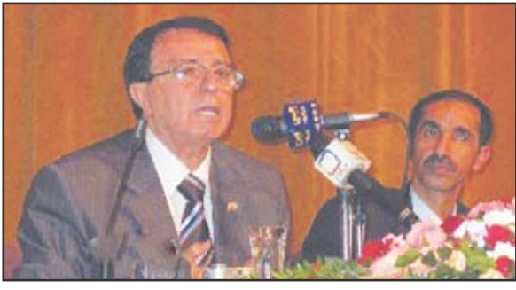
وزير الثقافة السوري

التاريخ العربي منوها بتجارب وأسماء وأماكن كانت ضمن مؤثرات التغيير والنهضة . وتنقل وزير الثقافة السوري عبر كل مراحل التاريخ الحضاري العربي الإسلامي ملقبا الضوء على كل مرحلة وملامح الخصوصية والعظمة العربية ثقافيا وفكريا وعلميا مؤكداً أن لكل مرحلة من تلك المرحلة خصوصية التفاهم والانسجام الذي كان قائماً بين الحاكم والعالم والسياسة والثقافة . وتحدث عن الدور الأموي في نسج تجليات نهضوية في تاريخ المشهد الثقافي العربي من خلال عاصمتهم الفيحاء (دمشق) .. مؤكداً عروبة المشهد الثقافي في سورية .