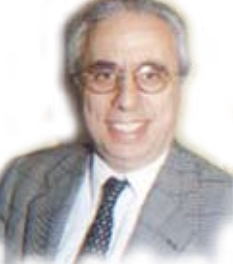
الشاعر اللبناني هنري زغيب

المعلمين إلى الإصحاح ونشر العلم في مدينة (سطفيل)، حيث دعا إلى إقامة مسجد حر (غير تابع للإدارة الحكومية) وفي عام 1924 زاره ابن باديس وعرض عليه فكرة إقامة جمعية العلماء ، وبعد تأسيس الجمعية أخذت الإبراهيمي نائباً لرئيسها وانتدب من قِبل الجمعية لأصعب مهمة وهي نشر الإصلاح في غرب الجزائر وفي مدينة وهران وهي المعقل الحصين للصوفية الطارقيين، فبادر إلى ذلك وبدأ ببناء المدارس الحرة ، وكان يحاضر في كل مكان يصل إليه ، وهو الأديب البارع والمتكلم الموهوب ، وأمدت نشاطه إلى تلمسان وهي واحة الثقافة العربية في غرب الجزائر وقامت قيامة الفئات المعادية من السياسيين والصوفيين وقدموا العرائض للوالي الفرنسي؛ يلمسون فيها إبعاد الشيخ الإبراهيمي ، ولكن الشيخ استمر في نشاطه ، وبرزت المدارس العربية في وهران . وفي عام 1939 كتب مقالاً في جريدة (الإصلاح) فنفته فرنسا إلى بلدة (أفلو) الصحراوية ، وبعد وفاة