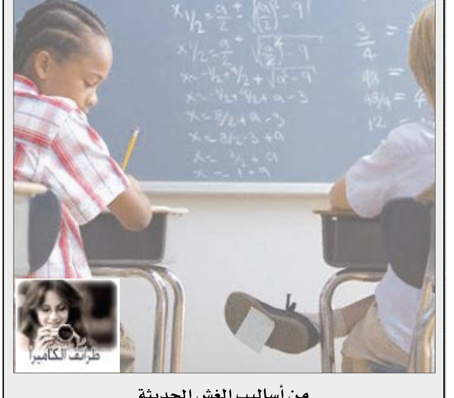
من أساليب الغش الحديثة

كلمات أقفا: 1- (المجاهد الرسولي) من ملوك الدولة الرسولية في اليمن خلف أباه 1321م كان شاعراً أدبياً محمود السيرة من آثاره مدرسة بمكة وأخرى يتعرّف حرف عطف. 2- اتجاه جانبي - دولة - ضمير المتكلم. 3- للنفى - ذكي - حلف. 4- من الكتب السماوية - نادي يماني عريق يعتبر أول نادي في اليمن والجزيرة العربية. 5- شجر طيب الرائحة ينبت في سواحل الشام - يصلح بالناس. 6- حرف إنجليزي - شهر سرياني - هرب . 7- أحرف متشابهة - مشكاة. 8- من أبطال اليونان الأسطوريين في حرب طروادة - رجاء. 9- النهر المقدس في الهند - خذع واطمع. 10- وثن - إمارة عربية. 11- في جسم الإنسان - مدينة إيطالية. 12- قلوي - من سور القرآن الكريم - غطي . وغلّب. عموديا 1- ابن سام ابن نوح عليه السلام - حذاء - للاستفهام العددي. 2- في الفم - اقتراب - من جبال تعز. 3- للنداء - أكبر جزيرة في العالم . حل العدد الماضي