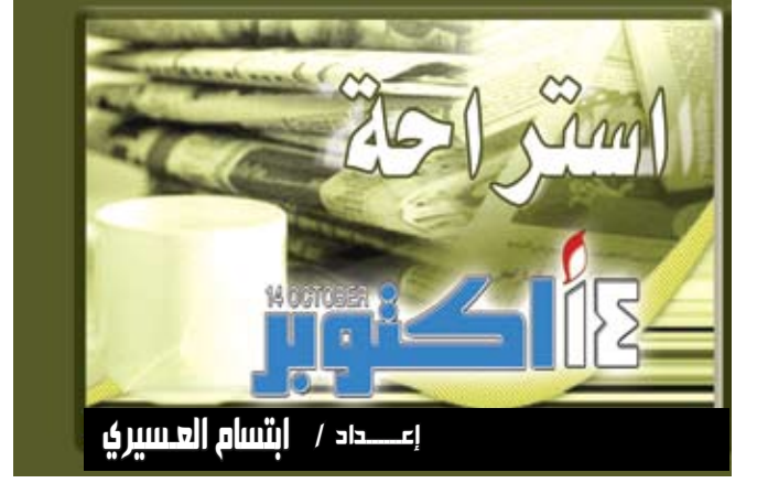
إعداد / إيتام العسيري

ملاحظات / متابعة : ذكر فريق من الباحثين الألمان أن تناول الأطعمة الغنية بالكاكاو يبدو أنه يساعد في خفض ضغط الدم خلافاً لتناول الشاي الذي قد لا يساعد في ذلك. ولم توضح نتائج البحث الذي نشر في دورية جاما التي يصدرها الاتحاد الطبي الأمريكي إن كانت تشير بتناول كميات كبيرة من الكاكاو لخفض الضغط لكن الباحثين يقولون إن من الواضح أن تناول منتجات بديلة للكاكاو مثل الشيكولاته وغيرها من المنتجات التي تحتوي على الكاكاو بكميات معقولة يساعد في ذلك. وتنصح الدراسة من يعانون من ارتفاع ضغط الدم بأن يتناولوا في وجباتهم المزيد من الفواكه والخضروات لأن مكونات مثل البوليفينول والفلافونويدات تفيد في تجنب ضغط الدم والمخاطر الناتجة عنه بالنسبة للأوعية الدموية. وقال المؤلفون في دراستهم إن منتجات الكاكاو والشاي مسؤولة