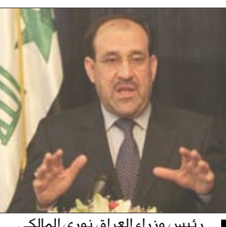
رئيس وزراء العراق نوري المالكي

وقال المالكي عن حكومته التي يقودها الشيعية في كلمة أمام البرلمان أن الأحداث التي وقعت الأسابيع الماضية أثبتت أن الحكومة محايدة وليست متحيزة وإنها لم تتخذ جانب هذا الحزب أو هذه الطائفة ضد أخرى. وأضاف أن الحكومة برهنت أيضا على أنه لا أمن لأي طائفة إلا إذا ضمنته الطوائف الأخرى. ومنذ تولي رئاسة الوزراء في مايو 2006 يواجه المالكي انتقادات مستمرة من الأقلية السنة بأنه قدم مصالح الأغلبية الشيعية على تلك الخاصة بالجماعات الطائفية والعرقية الأخرى بالبلاد. وتوصل التيار الصدري في البرلمان والاتفاق الشيعي الحاكم إلى اتفاق يوم السبت لإنهاء القتال بين بعض المسلحين من بعض الولايات المتحدة على بعض المواقع التي يعنون الولاء له. وقال الجيش الأمريكي أمس إن قواته قتلت ثلاثة مسلحين هاجموا دورياتهم أمس الأول الأحد وخلال الليل في مدينة الصدر.