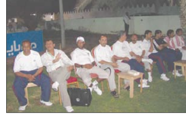
□ صنعاء / سبأ :

كرمت وزارة الشباب والرياضة يوم امس وفد الرياضة للجميع المشارك في المهرجان العربي الثاني للرياضة للجميع الذي استضافته المملكة العربية السعودية خلال الفترة 25 أبريل - 1 مايو ، وأحرز فيه الوفد ميداليات ذهبية ومراكز متقدمة .