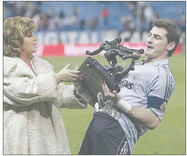
إسبانيا / 14 أكتوبر / متابعات / وكالات :

أعلنت صحيفة «ماركا» الأسبانية فوز حارس مرمى فريق ريال مدريد الأسباني لكرة القدم إيكر كاسياس بجائزة «زامورا» التي تهديها لأقل الحراس قبولاً للأهداف في الدوري الأسباني وذلك قبل مرحلتين من نهاية المسابقة. وأوضحت الصحيفة أن كاسياس سجن شباهة 32 هدفاً في 36 مباراة ليصل متوسط الأهداف التي تدخل مرمى ريال مدريد في المباراة الواحدة، مقابل هدف لكل مباراة في شبك ملاحه فيكتور فالديز حارس مرمى فريق برشلونة والذي لن يتمكن من معادلة رقمه مع تبقي مباراتين فقط. ونقلت «ماركا» عن كاسياس سعادته الكبيرة بالفوز بالجائزة للمرة الأولى في مسيرته، إلا أنه فضل إهداء الإنجاز لزملائه مؤكداً أنه ثمره عمل جميع أعضاء الفريق المتوج بلقب الدوري الأسباني للعام الثاني على التوالي. وكان كاسياس 27 عاماً/على وشك الفوز بالجائزة المنسوبة إلى الحارس التاريخي لأسبانيا ريكاردو زامورا في موسم 1999 / 2000 حين حرس مرمى الفريق الملكي للمرة الأولى، إلا أن الأرجنتيني مارتين إيريرا خطفها في آخر أسبوعين من الدوري حينذاك.