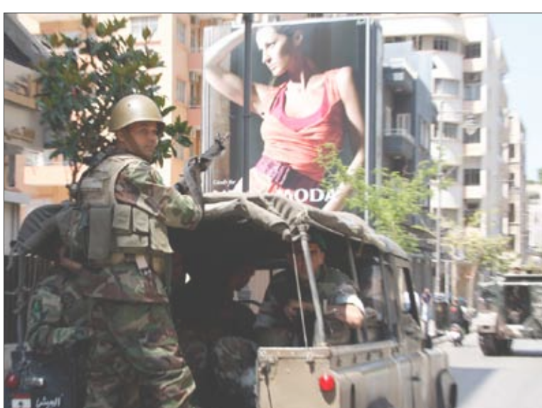
جنود الجيش اللبناني ينتشرون في بيروت

وجاءت مصادمات المعارضة أن الحكومة يجب أن تتراجع عن قراراتها وان توافق على اقتراح نبيه بري رئيس مجلس النواب واحد زعماء المعارضة البارزين بإجراء حوار مباشر قبل أن توقف المعارضة حملتها وإزالة الحواجز من الشوارع التي شلت العاصمة وأبقت مطار وميناء بيروت مغلقين. وقالت مصادر قريبة من التحالف الحكومي أن قادتها سينتظرون الوساطة العربية قبل اتخاذ أي قرار.