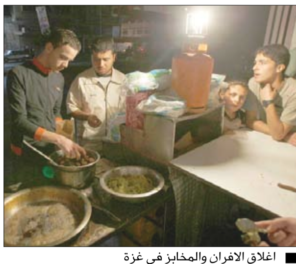
إغلاق الأفران والمخابز في غزة

كل شخص في جانب من حياتهم، من لحظة أن يستيقظوا في الصباح إلى أن يخلدوا إلى فراشهم في المساء، لقد أصبح الوضع هنا أقرب ما يكون إلى حياة الحيوان منه إلى الإنسان بالنسبة للسكان عمومًا. وأضاف أن إسرائيل تسمح بدخول 2.2 مليون لتر فقط من الديزل الصناعي إلى محطة الطاقة الوحيدة في القطاع كل أسبوع، مما يعني إمكانية إنتاج 45-55 ميغاوات من الكهرباء فقط، مقارنة بثمانين ميغاوات في حال العمل بكامل قدرة المحطة وأكثر من مائة ميغاوات قبل قصف الطائرات الإسرائيلية لمحولات المحطة منذ عامين. ومنذ السبت الماضي خفضت المحطة إنتاجها كثيراً، مما جعل مدينة غزة تعيش في ظلام دامس