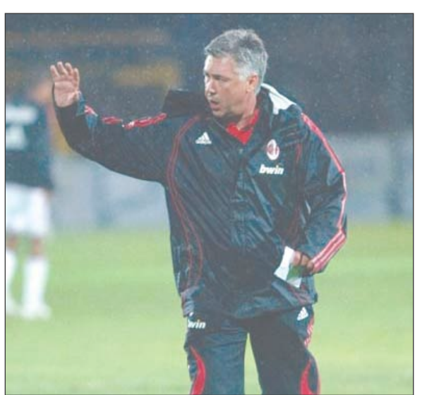
إيطاليا / 14 أكتوبر / متابعات / وكالات :

أعرب كارلو أنشيلوتي المدير الفني لنادي ميلان الإيطالي لكرة القدم عن أمله في أن يتمكن فريقه من التأهل لبطولة دوري أبطال أوروبا بالموسم المقبل، رغم فقدان المركز الرابع بترتيب الدوري الإيطالي، آخر المراكز المؤهلة للبطولة، لمصلحة منافسه فيورنتينا. وخسر ميلان مساء الأحد من مضيفه نابولي (1 - 3) في إطار منافسات الجولة قبل الأخيرة من مسابقة الدوري الإيطالي لهذا الموسم ليتجمد رصيده عند 61 نقطة بفارق نقطتين خلف فيورنتينا، الذي فاز على ضيفه بارما بالنسبة لنفسها ليتقدم إلى المركز الرابع بالبطولة. وعلق أنشيلوتي لموقع ميلان على الإنترنت قائلاً: "كان يوماً ثقيلاً، قدم فيه نابولي مباراة رائعة بينما لم نفعل نحن". ووم ذلك يرى مدرب ميلان أن إحرار المركز الرابع "أما زال ممكناً"، وقال: "قد تكون متخلفين الآن بالفعل، لكن لا تزال هناك 90 دقيقة على نهاية البطولة". ويستضيف ميلان فريق أودينيزي في الجولة الأخيرة من البطولة، فيما يخرج فيورنتينا لملاقاة تورينو، ويجب أن يفوز ميلان في تلك المباراة، مع خسارة أو تعادل فيورنتينا، كي يستعيد المركز الرابع ويتأهل لبطولة دوري أبطال أوروبا التي نال الفريق الإيطالي لقبها العام الماضي.