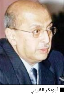
أبو بكر القربي

صنعاء / س : قال وزير الخارجية الدكتور أبو بكر عبدالله القربي: «أن المبادرة اليمنية المتعلقة بمعالجة الأزمة اللبنانية قد أدرجت ضمن القرارات الصادرة عن الاجتماع الطارئ لوزراء الخارجية العرب الذي عقد أمس في القاهرة». وذكر القربي في تصريح لوكالة الأنباء اليمنية (سبأ) لدى عودته إلى صنعاء مساء أمس أن الاجتماع الطارئ شكل لجنة برئاسة رئيس الوزراء القطري الشيخ حمد بن جاسم وعصوبه تسع دول عربية من ضمنها بلادنا وذلك للتوجه إلى بيروت بهدف الدعم والتهدئة للحوار بين الأطراف اللبنانية وصولاً إلى انتخاب رئيس الجمهورية وتشكيل حكومة وحدة وطنية.