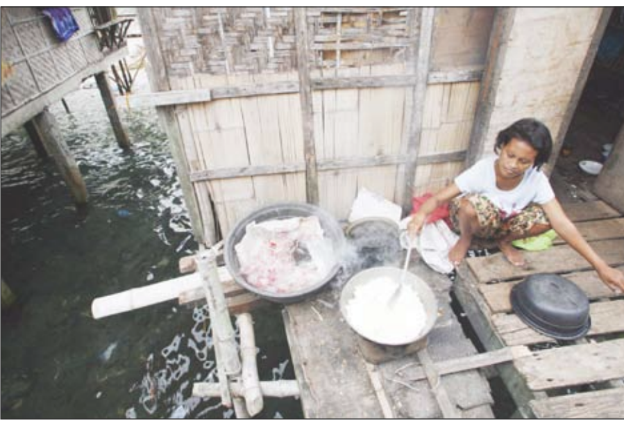
المؤسف أن العالم كان على علم ومنذ زمن طويل بالنمو السكاني العالمي الهائل والاحتياجات الكبيرة للسلع التي تلبى احتياجات العالم المتنامية من الغذاء ومستلزمات الصناعات الضرورية ورغم ذلك فإن هذا العالم أمل الاستثمار لإنتاج المواد الضرورية واتجه لصرف المليارات في تطوير التكنولوجيا وبشكل جنوني لتطوير صناعة الاتصالات الكمالية وكل ذلك لتدشين عصر العولمة وأسواقها المجنونة. والمزج والمخيف الإعلان المتصاعد على مختلف وسائل الإعلام ان ارتفاع أسعار كل من الطاقة والمواد الغذائية ناتج عن شحهما وعدم وجود ما يسد

تسجل أسعار العديد من السلع المستوردة مثل مواد البناء ومعدات بناء المشاريع الصناعية وغيرها نسبيا متصاعدة في أسعارها زاد بعضها على نسبة 100٪. ومشكلة ارتفاع معظم السلع تؤكد أن العالم نام طويلا واكتشف متأخرا الورطة الجديدة في النقص المزعج لبعض المواد الضرورية والتي تأتي في مقدمتها المواد الغذائية مما دفع الأمين العام للأمم المتحدة السيد بانكي مون إلى إصدار بيانه المزعج بأن العالم سيواجه مستقبلا مخيفا من