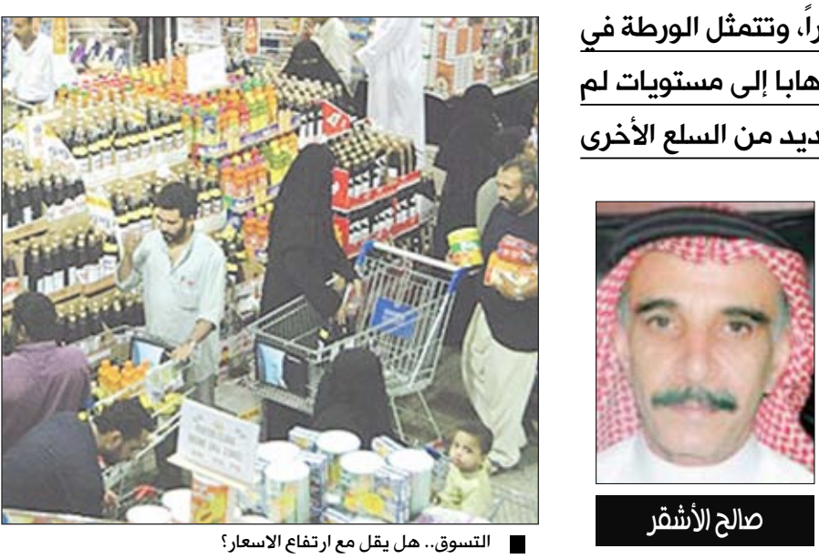
التسوق.. هل يقل مع ارتفاع الاسعار؟

تجاه أية محاولة للتخفيف من مخاطر مستقبلية ربما تؤدي إلى المجاعات والعطش في وضع ريفي عربي جفت مياهه ونضبت خيرات نتيحة للإهمال منذ عشرات السنين. وكما أشرنا سابقا الريف العربي الذي كان مصدر الخيرات من الماء والغذاء لسكان الريف والمدن معا وبوسائل قديمة هو الان مدمر ومرافقه متهاككة ومنتهية السلاححية مما اضطر أعداد كبيرة من سكانه تركه والهجرة إلى المدن لمضاعفة مشاكل وأعباء المدن الخدماتية والحياتية. والمثير للتساؤل والهشة أن المسؤولين العرب يظلون صامتين عن علمهم وقضاياها المهمة حتى يتطرق إليها الأجانب وبعد ذلك تعال وأسف ضجة التصريحات حول هذا الموضوع الخطير ولكن لفترة معينة حتى يسكت الأجانب فسركون معهم إلى أجل غير مسمى ولا يمانعون أو يرددون في الأيام العادية أن يصفروا الأوضاع كافة بأنها عشرة على عشرة وعلى خير ما برام رغم الأوضاع المريرة التي تظهر علينا بين فترة وأخرى عبر القنوات الفضائية.