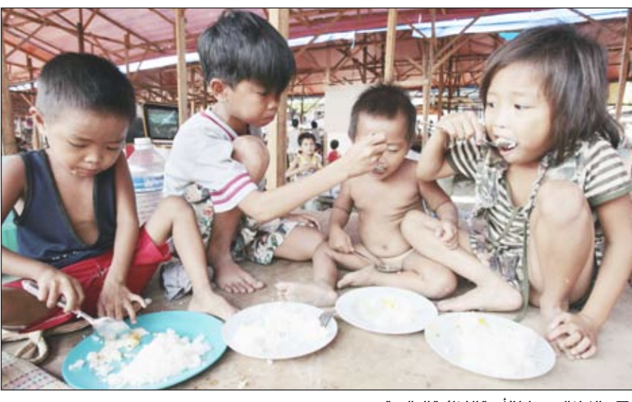
الاطفال ضحايا الأزمة الغذائية العالمية

والمضحك الصخرة الأخيرة بين المسؤولين في العالم العربي بعد سماعهم عبر الإعلام عن أخطار المستقبل حول أهمية تطوير الأرياف زراعيا وحيوانيا ومائيا لتلبية متطلبات المستقبل الغذائي من خلال الاستغلال المكثف والسريع وقبول وقوع الكارثة خاصة في بلاد سلة الغذاء العربي «السودان» التي كانت هذه السنة ضمن فقراراتنا الدراسية في المرحلة الابتدائية منذ زمن طويل. عن / صحيفة (الشرق) القطرية