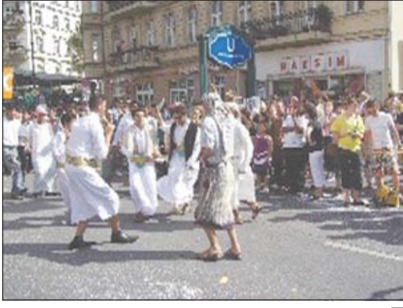
رقصة شعبية يمنية في المهرجان الألماني