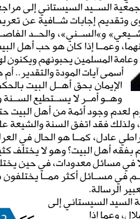
أثر فتوى موجودة على موقع المرجع الشيعي الأعلى في العراق السيد علي السيستاني، تحرم زواج السني من شيعية خوفاً من الضلال وصلاة الشيعي وراء إمام سني، انتقادات شددت على ضرورة مراجعتها حفاظاً على وحدة المسلمين ضد الطائفية المستشرية.

وأعربت جمعية الحوار الحضاري التي تأسست في لندن في أبريل الماضي بمبادرة من الكاتب الإسلامي المعروف أحمد الكاتب (55 عاماً) المعروفين والعرب، في رسالة مفتوحة وجهتها للسيد علي السيستاني، عن استغرابها لوجود بعض الفتاوى في موقع السيد علي السيستاني في قسم الأسئلة والأجوبة تتعلق بالصلاة خلف أهل السنة، وزواج الشيعية من سني، حيث أوصى السيد السيستاني بالصلاة ظاهرياً مع السنة، وأفتى بعدم جواز الزواج من السني إلا ما لمعنة للخوف من الضلال»، وذلك جواباً على سؤال فتاة «مستبصرة» عن الزواج المؤقت من رجل سني.