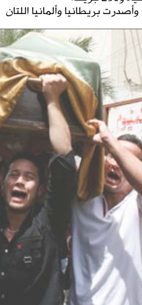
احد ضحايا القتال في شمال لبنان