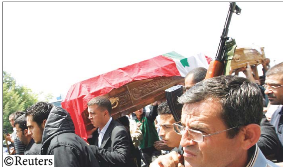
من مخلفات الأزمة اللبنانية

إيران وسوريا)، فسقط في فخ نوع آخر من الممانعة، أي تلك المتعلقة بالمشاركة الحقيقية والفاعلة في النظام السياسي والاجتماعي في لبنان، كل من قبله على الساحة منذ اجتاح بيروت هو تعبير عن تبني هذا الحزب لسياسة الهروب إلى الأمام. وهذا ما تدلل عليه أيضا