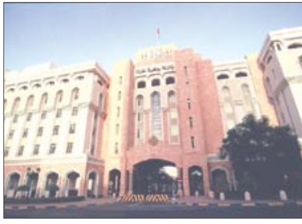
مركز البنك المركزي العماني

ونشرت النشرة الصادرة أن متوسط سعر الفائدة لتلك الشهادات كان 1ر27 بالمائة فيما بلغ أعلى سعر مقبول 1ر40 بالمائة مشيرة إلى أن مدة تلك الشهادات تصل إلى 182 يوماً حيث سيتم استحقاقها في الخامس من شهر نوفمبر القادم.