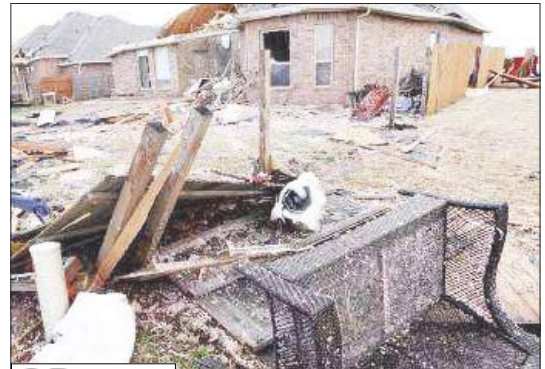
حطام ومنازل مدمرة بعد أعاصير ضرب منطقة ادموند في اوكلاهوما

14 أكتوبر/ رويترز: أعلنت السلطات في ولايتي ميزوري وأوكلاهوما الأمريكيتين أن 18 شخصاً على الأقل قتلوا في الولايتين أمس الأول بعدما اجتاحت أعاصير المنطقة. وقالت سوسي ستونر المتحدث باسم إدارة الطوارئ في ميزوري أن 12 شخصاً على الأقل قتلوا جراء الإعصار عشرة منهم بمقابلة يوتاون على الحدود مع أوكلاهوما. وأضافت «توجد كميات كبيرة من الحطام والسيارات المقلوبة» مضيفة أن الشرطة لم تستبعد العثور على مزيد من الضحايا. وكانت بلدة راسين الصغيرة بمقاطعة نيوتاون على بعد نحو 270 كيلومتراً جنوب كانساس سيتي هي الأشد تضرراً. وقال مسؤولون أن ستة أشخاص قتلوا في بلدة بيتشبر الصغيرة الواقعة في شمال شرق أوكلاهوما. وقالت ميشلين أوتين المتحدث باسم إدارة الطوارئ في أوكلاهوما «منطقة مؤلفة من 24 مبنى دمرت فعلياً». وأضافت أن براد هنري حاكم أوكلاهوما أمر قوات الحرس الوطني بالوصول إلى بيتشبر صباح أمس للمساعدة في عمليات الإنقاذ. وأوضحت أوتين أن جهود البحث عن المفقودين في بيتشبر توقفت لأن تحرك رجال الإنقاذ وسط الركام في الليل غير آمن رغم وجود وسائل الإضاءة المتحركة التي تستخدم في الفيضانات. وفي ميزوري قال هوارد بيردسونج رئيس بلدية نيوشو وهي بلدة يسكنها 11500 نسمة في نيوتاون أن شخصين على الأقل قتلوا عندما تسبب الإعصار في انقلاب مركبة.