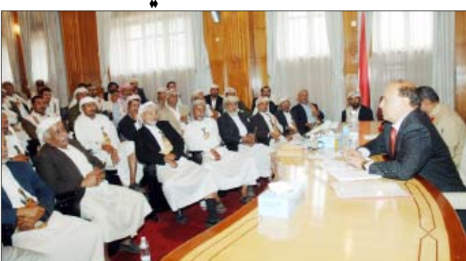
واشار الى أنه سيصدر توجيهاته للحكومة بإعطاء الأولوية لتسريع وتائر التنمية في محافظة مأرب.

أكد نائب رئيس الجمهورية عبره منصور هادي التزام الدولة بتنفيذ الخطط التنموية في مأرب وبصفة خاصة ما يتصل منها بالبنية التحتية التي تتصل بتطور معيشة الإنسان وحياته اجتماعياً واقتصادياً وثقافياً. وقال خلال لقائه وجهاء ومشاخ محافظة مأرب أمس في صنعاء: «إن التعرض للسياح أو عابري الطرق يعتبر عائقاً مباشراً وأساسياً أمام تنفيذ المشاريع التي تحتاجها محافظة مأرب على مستوى التربة والتعليم والكهرباء والمياه والصحة العامة والطرق».