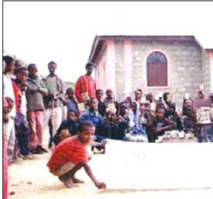
خيرية الشارقة توفر نسخا من المصحف الشريف بكل اللغات في ستة وثلاثين دولة

بمبادرة خيرية الشارقة الخيرية تنفيذ حملة لتنشيط مشروعها الدائم لطباعة المصحف الشريف وتوزيعه في مختلف بقاع الأرض خصوصا بالدول الفقيرة في قارتي أفريقيا وآسيا بأكثر من لغة من اللغات الدارجة وذلك في إطار حرصها على أداء المهام الإنسانية والخيرية التي تقع ضمن أولويات اهتمامات منظومة الخير والبر التي تقودها.