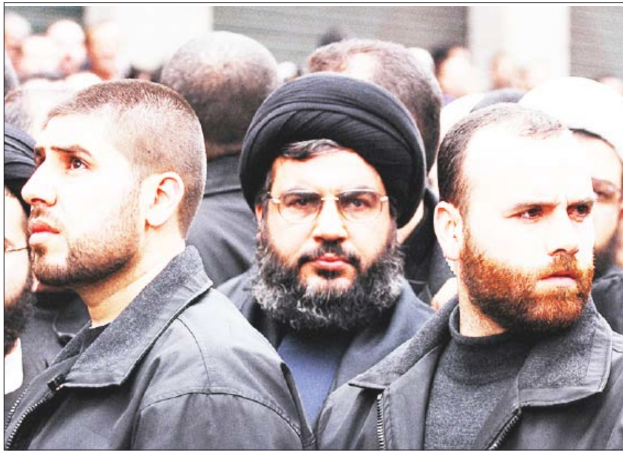
حسن نصر الله بين جنوده في بيروت

عون حساباته كشخصية سياسية لبنانية. ولكن الخطير هو إقحام شيعة لبنان في هذه المغامرة، حيث انخرط المجلس الإسلامي الشيعي الأعلى في الصراع الجاري وجبر تحركات حزب الله ضد الحكومة من منطلق طائفي، من خلال التأكيد على رفضه تهميش الطائفة على يد حكومة غير شرعية. وتم كل ذلك (بيان المجلس وخطاب الشيخ قبلا)، يوم الخميس وقبيل خطاب السيد حسن نصر الله، مما أعطى لهذا الأخير "مصادقية طائفية" إن صح التعبير، إضافة إلى المصادقية المعلنة كمقاومة. وكان الأخرى بممثلي الطائفة الشيعية أن يناوؤا بأنفسهم عن الصراعات السياسية وأن لا يخوضوا في موضوع الولاء أو عدم الولاء لإيران، فهم قبل كل شيء ممثلون لمواطنين لبنانيين ومن حق كل كيان تمثيلي للشعبية أن تكون له علاقات بإيران، إلا أن ربط نفسه بالسياسة الإيرانية بشكل خطا كبيرا بحق