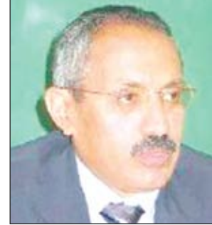
غازي شائف الإغبري

دعا وزير العدل الدكتور غازي شائف الإغبري خريجي الدورة الـ13 من المعهد العالي للقضاء إلى إعمال القوانين النافذة في كل ما يعرض عليهم ، والعمل بدقة وعدم الاستعجال في إبداء الرأي واتخاذ القرارات، والابتعاد عن ممارسة أي نشاط سياسي.