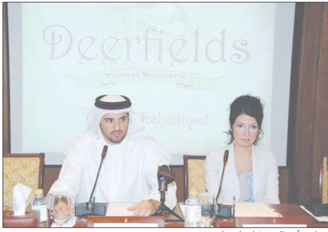
إم بي أي تطلق دير فيلدز تاون سكوير