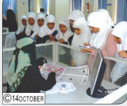
ع/عدن/ 14 أكتوبر: تصوير / جان عبد الحميد