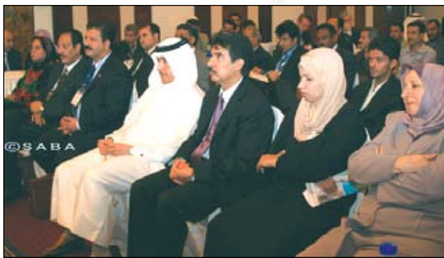
ع/عدن/ سبأ: قالت الأخت الدكتورة امة الرزاق على حمد وزيرة الشؤون الاجتماعية والعمل ان نسبة الفقر العام في اليمن حسب الإحصاءات الرسمية والوطنية والدولية انخفضت من 41% إلى 34%،5 فيما انخفض فقر الغذاء من 18% إلى 12%. ذكرت ذلك في كلمتها التي ألقتهابافتتاح الحلقة النقاشية حول الفقر ومقاييسه المختلفة بدول مجلس التعاون الخليجي في ضوء الأهداف التنموية للألفية التي تنظمها وزارة الشؤون الاجتماعية والعمل بالتعاون مع المكتب التنفيذي لمجلس وزراء العمل ووزراء مجلس التعاون لدول مجلس الخليج العربي. وأرجعت أسباب الانخفاض في مستويات ومؤشرات الفقر إلى السياسات الاقتصادية التي اتبعتها الحكومة والدعم الدولي الذي أثمر عنه مؤتمر التنمية لبرنامج الرئيس الانتخابي الخاصة بالتخفيف من الفقر وتوسيع مظلة الرعاية الاجتماعية ومواجهة مشكلة البطالة. وأوضحت الوزيرة أهمية الحلقة النقاشية حول الفقر التي تعكس التوجه الحقيقي لإيجاد معايير موحدة لقياس مؤشرات في الوطن العربي خاصة بوجود سمات مشتركة من جهة وتطلعات للاندماج والتكامل الاقتصادي من جهة أخرى. واستعرضت أهداف دول مجلس التعاون في متابعة تحقيق الأهداف التنموية للألفية.. معتبرة قضايا الفقر والتخفيف من أثاره في مقدمة الأهداف من خلال الأساليب العلمية والعملية بما يتوافق والمعطيات التي تتخصها ظروف المنطقة وما يفرضه العولمة واشتراطاتها. متمنية للحلقة النقاشية أن تثمر عن نتائج ايجابية تسهم في التعرف على تطویر مؤشرات قياس الفقر وضبط معايير ورصده في دول المجلس بما يتوافق مع معطياتها الاقتصادية والاجتماعية والسياسية بشكل علمي ومدروس وفقا لأوراق العمل والنقاشات التي ستطرخ من مجموعات العمل. من جانبه حدد المدير التنفيذي لمجلس وزراء العمل ووزراء الشؤون