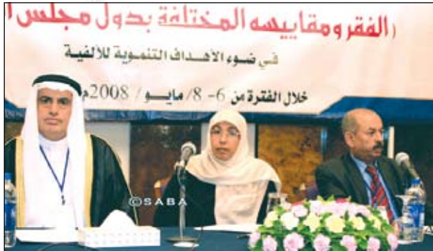
الفقر ومقاييسه المختلفة بدول مجلس التعاون