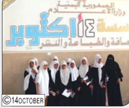
قام عدد من طالبات مدرسة (ريدان) للتعليم الأساسي في مديرية المعلا بزيارة استطلاعية لمؤسسة (14 أكتوبر) للصحافة والطباعة والنشر.