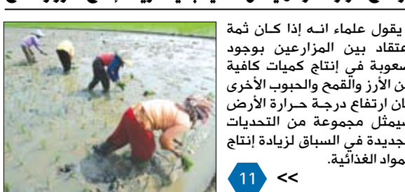
يقول علماء انه إذا كان ثمة اعتقاد بين المزارعين بوجود صعوبة في إنتاج كميات كافية من الأرز والقمح والحبوب الأخرى فان ارتفاع درجة حرارة الأرض سيمثل مجموعة من التحديات الجديدة في السباق لزيادة إنتاج المواد الغذائية.