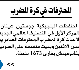
احتفظت البلجيكية جوستين هينان بالمركز الأول في التصنيف العالمي الجديد للاعبات كرة المضرب المحترفات الصادر يوم امس الاثنين وبقيت متقدمة على الصربية أنا ايفانوفيتش بفارق 1673 نقطة.