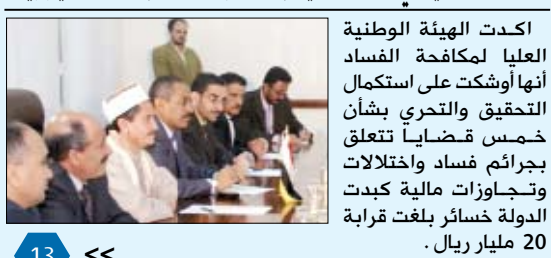
أكدت الهيئة الوطنية العليا لمكافحة الفساد أنها وشككت على استكمال التحقيق والتحري بشأن خمس قضايا تتعلق بجرائم فساد واختلالات وجاوزات مالية كبدت الدولة خسائر بلغت قرابة 20 مليار ريال.