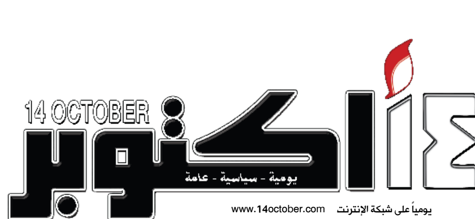
يومية على شبكة الإنترنت www.14october.com

78% يرون أهمية انتخابات المحافظين و71% مع أن يكونوا من أبناء المحافظة