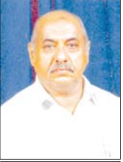
الشيخ الدكتور /