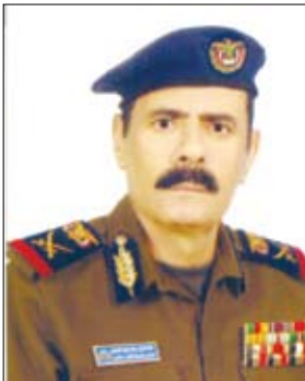
صالح حسين الزوعري

عدن / عيادروس نورجي : أكد اللواء ركن / صالح الزوعري نائب وزير الداخلية أن كافة إجراءات قد اتخذت من قبل وزارة الداخلية لإنجاح فعالية أسبوع المرور العربي في عموم محافظات الجمهورية الذي يبدأ يوم غد الأحد تحت شعار (السلامة للجميع هدفاً). وقال في تصريح لصحيفة (14 أكتوبر) إن كافة التدابير قد اتخذتها الوزارة للحد من الحوادث المرورية المؤسفة، حيث رفعت إدارات المرور في المحافظات بالوسائل والأجهزة الحديثة التي تمكنها من كشف السرعة المفرطة المتجاوزة للسرعة المحددة على الطرقات السريعة والمخالفين وضبطهم في ذات الوقت وفرض غرامات فورية عليهم. وأوضح أن كافة الترتيبات لإقامة أسبوع المرور العربي قد اكتملت، حيث سيتم التركيز على نشر الوعي المروري عبر الندوات والمحاضرات والزيارات الميدانية إلى مختلف المدارس والجامعات واللقاء