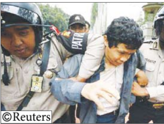
احتجاجات في اندونيسيا

جاكرتا / 14 أكتوبر (رويترز) : سار موكب الشعلة الاولمبية تحت حراسة مشددة داخل استاد في جاكرتا عاصمة اندونيسيا يوم الثلاثاء بعدما منعت الشرطة نحو مئة من المتظاهرين المعارضين للصوم من إعاقة أحد محطات الشعلة في رحلتها المحفوفة بالمخاطر حول العالم. وأفقد توفيق هدايت نجم الريشة الطائرة الاندونيسي وصاحب الميدالية الذهبية في الألعاب الاولمبية المرجل وسط صيحات فرح من نحو 2500 رجل شرطة وألف من أفراد القوات المسلحة قاموا بحماية الشعلة التي تسببت في مظاهرات معادية للصين أثناء رحلتها في أوروبا والأمريكيتين بعد هجم بكن الشهر الماضي لتظاهرات في إقليم التبت. وشارك نحو 80 رياضيًا ومسؤولًا ونجوم تلفزيون وسينما في مسيرة التي امتدت لمسافة سبعة كيلومترات. وفي وقت سابق يوم الثلاثاء وقعت مواجهات لمدة 30 دقيقة بين الشرطة والمتظاهرين أمام البوابة الرئيسية لاستاد بونج كارنو الذي يحمل اسم سوكارنو أول رئيس لاندونيسيا. وقال هدايت بعد إيقاف المرجل «أنا فخور للمشاركة في هذه المسيرة التي أن أتمكن من العودة ببيدالية ذهبية مثلما فعلت قبل أربع سنوات.» وكان من المقرر في البداية أن تمر الشعلة عبر شوارع العاصمة لكن مسؤولين رياضيين قالوا انه سيتم تقييد المسيرة لتقام فقط داخل استاد بونج كارنو.