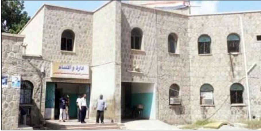
مستشفى الامراض النفسية والعصبية

ومع مرور الأيام ومنذ اليوم الأول لمهامه أراد هذا المدير ان يكون شعاره: ( العمل خارج الجدران ) .. بالإضافة إلى التواصل اليومي مع عدد من الساكنين في المديرية وكذا منتدياتها لحرص التواصل معهم باعتبارها صديقاً وزميلًا قديماً. هذا التواصل وكذا اللقاءات المستمرة لم تكن تخلو من مناقشة هموم المواطنين وماهي البعثات والصعوبات والمشاكل التي تواجهها المديرية ولا يقتصر الأمر على سماع الهموم والشكاوى ولكن محاولة العمل على حلها إذا كانت تتطلب تدخله الفوري وبشاركه في ذلك زميله الأمين العام للجلس المحلي في كثير من لقاءاته وتواصله مع الناس بحيث يقوم بالاتصال بالجهات