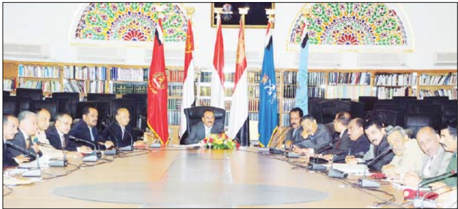
■ مجلس الدفاع الوطني

عبرت القيادات التربوية والتعليمية والشبابية في محافظة ذمار عن ترحيبها وتأييدها المطلق للقرار الأخير الذي اتخذته فخامة الأخ علي عبدالله صالح رئيس الجمهورية بشأن إجراء انتخابات محافظي المحافظات في شهر مايو المقبل، والذي يرمي إلى تعميق وتجذير الممارسة الديمقراطية، وتوسيع المشاركة الشعبية في اتخاذ القرار، وإدارة الشؤون المحلية في مجالات التنمية الاقتصادية والاجتماعية والثقافية وتأكيد اللامركزية المالية والإدارية. وأشارت القيادات التربوية والتعليمية والشبابية بمحافظة ذمار في أحاديث أدلت بها لـ (14 أكتوبر) إلى أن قرار انتخاب محافظي المحافظات يأتي على طريق تطوير آليات الممارسة الديمقراطية وتوسيع نطاقها تجسيدا للوعي الذي وصل إليه شعبنا اليمني، وقدرته على كسب رهاناته عبر الديمقراطية، ومواصلة مسيرة الخير والعطاء في ظل راية الوحدة المباركة التي رفعت خفاقة في سماء الوطن يوم الثاني والعشرين من مايو 1990م.