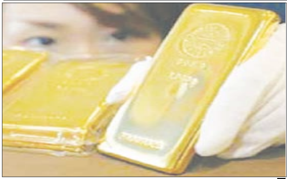
معرض الذهب والمجوهرات

يذكر أن جائزة قطر لسيدات الأعمال مفتوحة للسيدات القطريات وتخصص لفئتين هما سيدات الأعمال والسيدات المهنيات. وعلى المرشحة عن فئة سيدات الأعمال أن تكون مالكة لشركة أو عمل تجاري راهن في دولة قطر منذ ما لا يقل عن ثلاث سنوات تحت إدارتها وأن تكون مسؤولة بشكل كامل عن أداء أعمالها الحالية. أما بالنسبة لفئة السيدات المهنيات، فيجوز للمرشحة أن تكون موظفة في أي قطاع مهني أو حرفي في دولة قطر وقد عملت في هذا القطاع لمدة لا تقل عن ثلاث سنوات. وستقام الورشات باللغتين العربية والإنجليزية في مقر غرفة تجارة وصناعة قطر على الطريق الدائري الثالث وذلك في الأيام التالية: 28 أبريل 14 مايو و15 مايو و2 يونيو بين ظهر المرأة القطرية كشخصية قيادية في مجال الأعمال والوظائف المهنية الإحترافية وبروز دورها المحوري في النمو والأزدهار الاقتصادي الذي تشهده البلاد حالياً. كما يصور الشعار المرأة القطرية وهي تتسبر بخطى وثقة على قطر لسيدات الأعمال 2008 من تصميم فاطمة المغني، وهي إحدى الخريجات المتميزات من جامعة فرجينيا كومنولث - قطر. يستلهم الشعار في تصميمه ظهور المرأة القطرية كشخصية قيادية في مجال الأعمال والوظائف المهنية الإحترافية وبروز دورها المحوري في النمو والأزدهار الاقتصادي الذي تشهده البلاد حالياً.