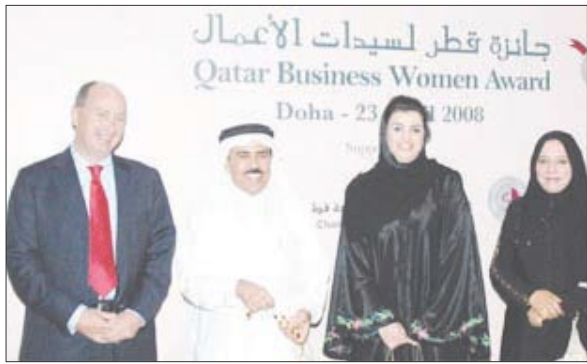
سيدات أعمال قطريات

كل هذه المعاني يتناغم وانسجام. فالعلم القطري الذي يوظف الشكل العام للمرأة هو بمثابة تأكيد على الاعتراف المتبادل بين المرأة المحتشمة والأمة حيث يصور أعضائها الآخر. أما اللؤلؤة فترمز للحصاة الثمين الذي جناه الشعب عبر تعليم المرأة. وبالرغم من الرقة والبساطة التي يبدو عليهما التصميم إلا أنه في الواقع عميق وجريء في إظهار نجاح المرأة القطرية والاعراب عن التقدير لها.