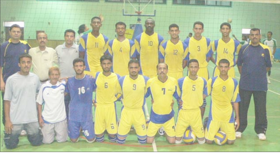
شعلة عدن البطل

33 نقطة محتلا المركز الأول بدون منافس بغض النظر عن نتائج أقرب منافسيه في الدوري وهما الصقر وشباب القطن في هذه الجولة والجولة الأخيرة ولكل منهما 29 نقطة. فيما أصبح رصيد هلال السويدي 20 نقطة في المركز قبل الأخير قرباً من الهبوط إلى الدرجة الثانية بعد أهلي الغيل الذي تأكد هبوطه رسمياً إثر خسارته يوم أمس الأول في ختام الجولة السادسة عشرة أمام شباب القطن ثالث ترتيب البطولة بثلاثة أشواط دون مقابل، ليواصل أهلي الغيل احتلال المركز العاشر والأخير برصيد 16 نقطة دون أي فوز.