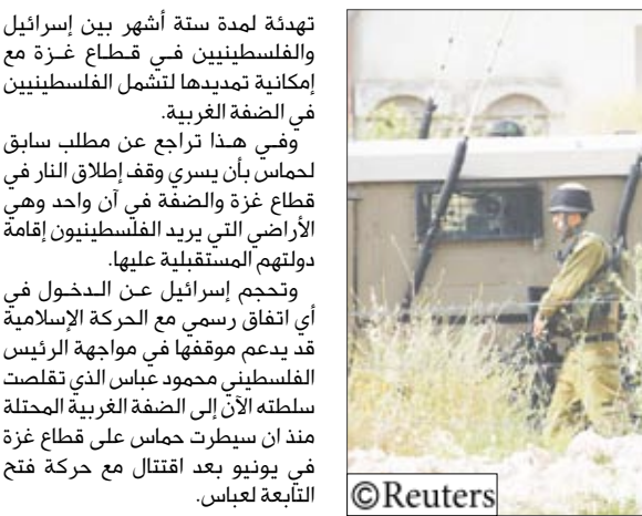
استعدادات إسرائيلية على حدود غزة

من بين القتلى واحد ما يصل إلى 25 شخصا أصيبوا وأعلن المتحدث باسم حركة مؤيدة لحركة طالبان الأفغانية بقودها المتشدت بيد لله المحسود المسؤولية عن الهجوم.