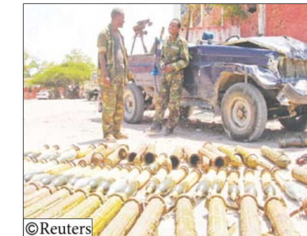
قوات صومالية متحالفة مع إثيوبيا تضبط مجموعة من الأسلحة

كما شهد معبر رفح جنوبي القطاع مظاهرات مماثلة تدعو لفتح المعابر وكسر الحصار الإسرائيلي المفروض على غزة منذ نحو عام.