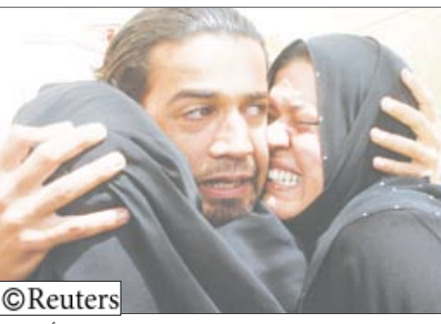
مشاهد من الحزن الذي يعيشه العراقيون جراء الغارات الأمريكية

كما شهد معبر رفح جنوبي القطاع مظاهرات مماثلة تدعو لفتح المعابر وكسر الحصار الإسرائيلي المفروض على غزة منذ نحو عام.