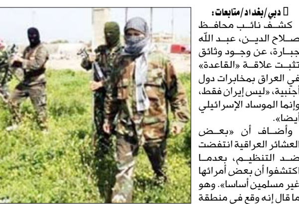
افراد من قاعدة العراق