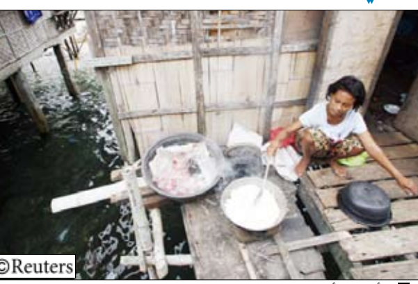
أسعار الأرز تسجل مستويات قياسية

قال بان جي مون الأمين العام للأمم المتحدة أمس الجمعة إن ارتفاع أسعار الغذاء تحول إلى أزمة عالمية. وتصاعدت المخاوف بشأن الأمن الغذائي هذا الأسبوع مع تسجيل أسعار الأرز مستويات قياسية في آسيا وحذرت الولايات المتحدة من أن أسعار المحاصيل الرئيسية التي يعيش عليها الجوعى في العالم تزداد ثمناً. وقال بان للصحفيين في فيينا «الارتفاعات الحادة في أسعار الغذاء تحولت إلى أزمة عالمية حقيقية». وأشار الغضب إزاء تكاليف الغذاء والمطاقة في الشهور الأخيرة موجة احتجاجات في عدة دول.