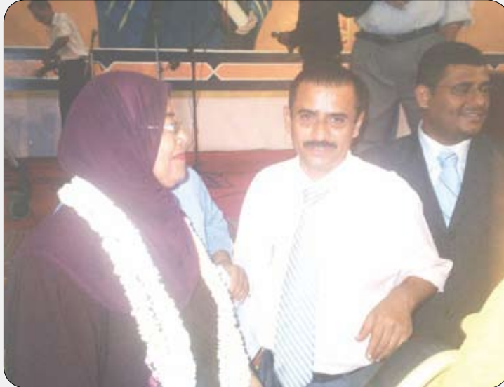
(14) تريبوياً في يوم المعلم يوم 27 أبريل بالعاصمة صنعاء.