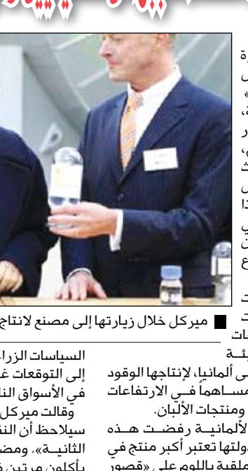
ميركل خلال زيارتها إلى مصنع لانتاج الوقود الحيوي بالمانيا

برلين ووكالات: حملت المستشارة الألمانية أنجيلا ميركل «تغير العادات الغذائية» في البلدان النامية، مسؤولة ارتفاع أسعار الغذاء في العالم، معتبرة أنه «إذا كان ثلث الشعب الهندي سيأكل مرتين في اليوم»، وإذا بدأ 100 مليون صيني بشرب الطيب، فإن ذلك سيتسبب بارتفاع أسعار الغذاء. في المقابل، دافعت ميركل عن الاتهامات التي توجهها الجماعات المدافعة عن البيئة والجماعات الإنسانية إلى ألمانيا، لإنتاج الوقود الحيوي، الذي يرونه مساهمًا في الارتفاعات الحادة بأسعار الحبوب، ومنتجات الألبان. لكن المستشارة الألمانية رفضت هذه الاتهامات، خاصة وأن دولتها تعتبر أكبر منتج في أوروبا للوقود الحيوي، ملقبة بالوم على «قصور