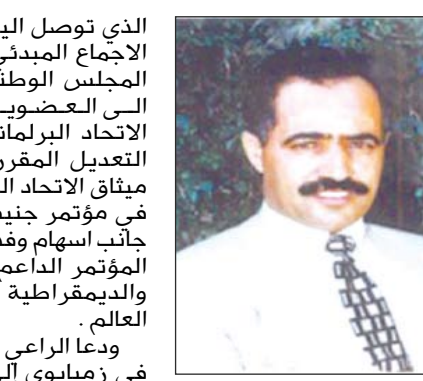
يحيى علي الراعي

الذي توصل اليه المؤتمر حول الاجماع المبدئي على التصاميم المجلس الوطني الفلسطيني الى العضوية الكاملة في الاتحاد البرلماني الدولي بعد التعديل المقرر إجراؤه على ميثاق الاتحاد البرلماني الدولي في مؤتمر جنيف القادم .. الى جانب اسهام وفد اليمن في قرار المؤتمر الداعم لعملية السلم والديمقراطية والحريات في العالم . ودعا الراعي لجنة الانتخابات في زيمبابوي إلى سرعة اعلان نتائج الانتخابات احتراماً لارادة شعب زيمبابوي واحترام الاحتكام الى صندوق الانتخابات . ونوه بالقرارات الأخرى التي اتخذها المؤتمر