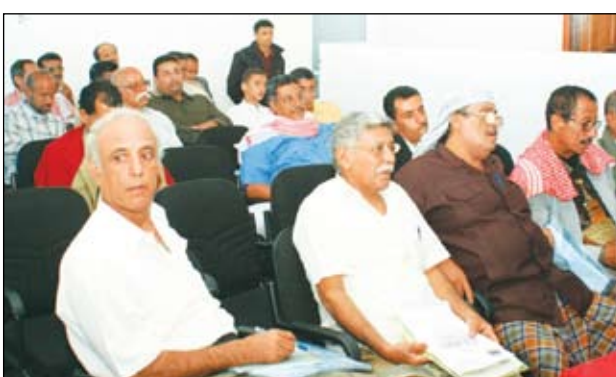
اجتماع الدورة الثانية للهيئة العليا للتجمع الوحدوي

بعث فخامة الأخ الرئيس علي عبدالله صالح رئيس الجمهورية برقية عزاء ومواساة لأخوين دغسان صالح هندي دغسان وعمر صالح هندي دغسان وكافة أفراد أسرة آل دغسان بوصاة الفقيه الشيخ صالح صالح هندي، جاء فيها: الأخوين دغسان صالح هندي دغسان وعمر صالح هندي دغسان وكافة أفراد أسرة آل دغسان، حياكم الله. بأسف بالغ وحزن عميق تلقينا نبأ الحادث الإجرامي الأليم الذي أودى ب حياة المغفور له بإذن الله تعالى الشيخ صالح هندي دغسان على مجلس النواب مع نجله ومراقه عز أيد أئمة. لقد خسرت الوطن برحيله واحدا من أبنائه المخلصين والأوفياء، فلقن