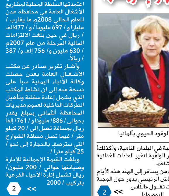
ميركل خلال زيارتها إلى مصنع لانتاج الوقود الحيوي بالمانيا

بلغ إجمالي قيمة الأعمال التي اعتمدها السلطة المحلية لمشاريع الأشغال العامة في محافظة عدن للعام الحالي 2008م ما يقارب / 477 مليوناً و 697 مليوناً و 477 الف ريال / في حين بلغت الالتزامات المالية المرحلة من عام 2007م / 630 مليون و 756 الف و 387 / ريالا. وأشار تقرير صادر عن مكتب الأشغال العامة بعدين حصلت وكالة الأنباء اليمنية سبأ على نسخة منه إلى أن نشاط المكتب الذي يشمل إعادة سفتة وتأهيل الطرقات الداخلية لعموم مديريات المحافظة الثماني يبلغ يقدر بحوالي / 886 / مليوناً و / 761 / ألفا ريال بمسافة تصل إلى / 20 كيلو متر / فيما تصل مسافة الشوارع التي ستترصف بالحجارة إلى نحو / 25 كيلو متراً / . وبلغت القيمة الإجمالية للإنارة في الأسواق الناشئة. وقالت ميركل من يسافر إلى الهند هذه الأيام سيلاحظ أن النقاش الرئيسي يدور حول الوجبة الثانية. ومضت تقول «الناس يأكلون مرتين في اليوم وادا