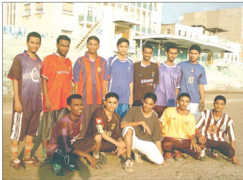
فريق رباط العيدروس