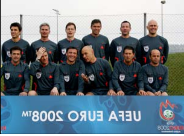
حكام يورو 2008