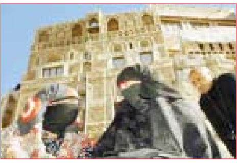
عمل روائي تحول إلى فيلم «يوم جديد في صنعاء القديمة»

والرواية في المحافطات، وتعريفهم بما وصلت إليه تجارب الرواد العرب الكبار، وخلق علاقات تواصل بين رواد القصة والرواية اليمينية، وروادها في البلدان العربية، وتعريفهم الكتاب العرب بما وصلت إليه الرواية والقصة في اليمن.