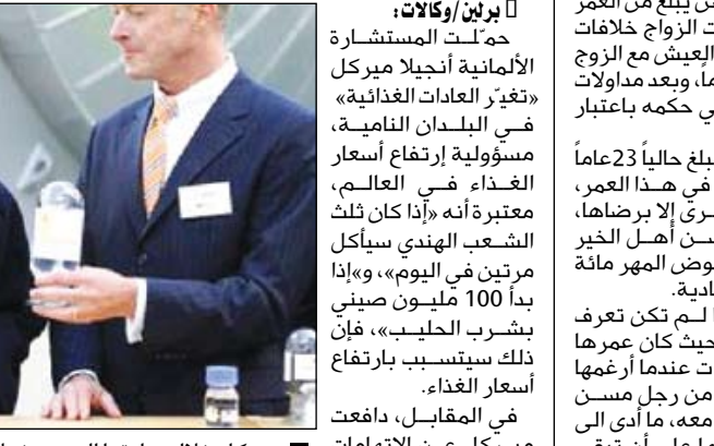
ميركل خلال زيارتها إلى مصنع لإنتاج الوقود الحيوي بألمانيا