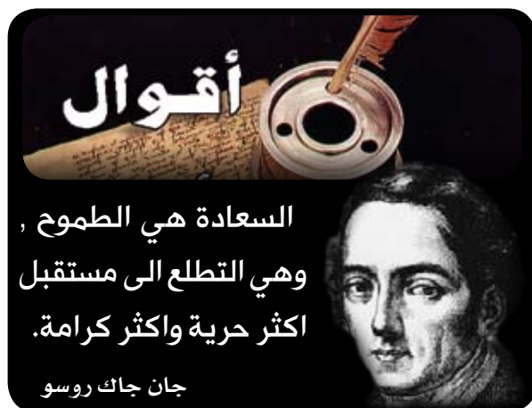
جان جاك روسو

تتهنت عازفة قيثارة من ولاية كاليفورنيا الأميركية إلى أن الأصوات الموسيقية المنبعثة من هذه الآلة تهدي أضخم الحيوانات واستخدمت مهاراتها لتهنئة حيوانات في المستشفيات وحدائق الحيوان. وذكّرت مصادر أميركية أن العازقة سوزان رايوند تحول في كافة أنحاء الولايات المتحدة وتزور الحيوانات المريضة والمكتنبة وتستخدم قيثارتها لتهنئة الحيوانات المتوحشة من خلال الموسيقى.