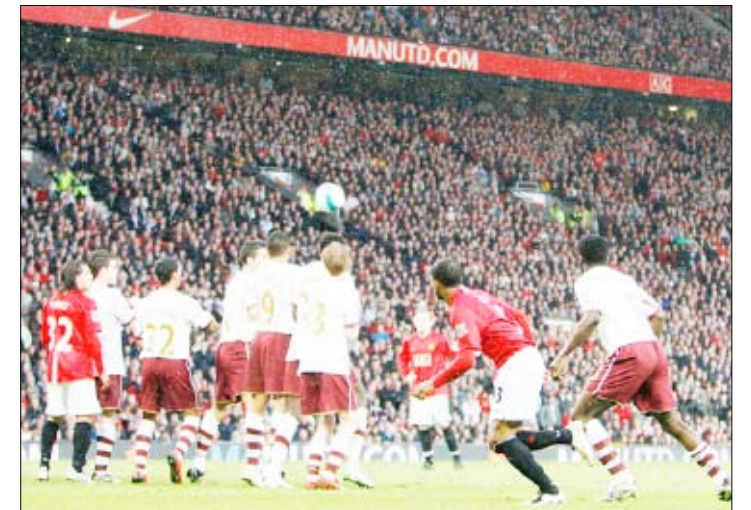
لقطة من البطولة

اندريا فورونين هدف ليفربول الثالث في الدقيقة الأخيرة من الوقت الأصلي للمباراة قبل أن يسجل روكي سانتا كروز مهاجم المنتخب باراجواي هدفاً شرفياً للضيوف في الوقت المحتسب بدل الضائع. ورفع ليفربول رصيده بعد هذا الفوز إلى 66 نقطة في المركز الرابع متقدماً بفرق خمس نقاط على جاره ايفرتون في صراع الفريقين على انتزاع بطاقة التأهل الأخيرة لدوري أبطال أوروبا.