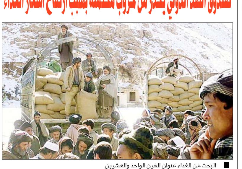
البحث عن الغذاء عنوان القرن الواحد والعشرين

العالمي، وأضاف أن التنمية التي تحقق خلال ما بين خمس إلى عشر سنوات يمكن أن تعرض للتدمير التام محذراً من أن الاضطرابات الاجتماعية يمكن أن تقود إلى الحرب. وشهدت أسعار الحبوب مثل الذرة والقمح والأرز وغيرها من المواد الأساسية ارتفاعات كبيرة في الأونة الأخيرة. في الوقت نفسه أعلنت اللجنة النقدية والمالية في صندوق النقد الدولي أن الأزمة المالية الحالية هي ذات طابع عالمي، ولكنها لم تنشر إلى مسؤولية الولايات المتحدة