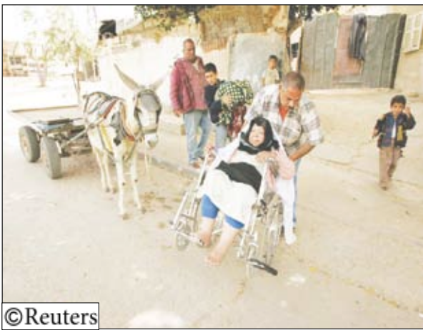
تواصل معاناة الفلسطينيين بعد تهجيرهم

فلسطين المحتلة/ 14 أكتوبر/ رويترز: قال منظمو لإحياء فعاليات الذكرى الستين للنكبة أمس الأحد ان احتفالات هذا العام ستكون استثنائية مع مرور ستين عاما على تهجير الشعب الفلسطيني من أرضه. وقال أعضاء اللجنة الوطنية العليا لإحياء الذكرى النكبة في مؤتمر صحفي في رام الله بالضفة الغربية أعلنوا فيه عن برنامج فعاليات إحياء النكبة «الذكرى الستون للنكبة ستكون ذكرى استثنائية مميزة بنشاطات تقام في الأراضي الفلسطينية وفي كل التجمعات الفلسطينية في الشتات». ويقدّر جهاز الإحصاء المركزي الفلسطيني عدد اللاجئين الفلسطينيين المقيمين خارج فلسطين بخمسة ملايين لاجئ مع نهاية عام 2006 «يتركز وجودهم في الأردن 2.8 مليون وفي باقي الدول العربية 1.6 مليون نسمة وينوزع الباقون على أنحاء مختلفة من الدول الأوروبية والأمريكيتين». وأشارت قاعدة بيانات الجهاز المركزي للإحصاء إلى أن «44 في المائة من سكان الأراضي الفلسطينية لاجئون حيث بلغ عددهم 1.8 مليون لاجئ منتصف عام 2007 بواقع 780 ألف لاجئ في الضفة الغربية وما يربو على المليون لاجئ في قطاع غزة». ويحيي الفلسطينيون الذكرى الستين للنكبة هذا العام تحت شعار «لا يبدل عن العودة إلى ديارنا» مع إقامة فعاليات متعددة في مدن وقرى ومخيمات الضفة الغربية وقطاع غزة وأخرى في المخيمات الفلسطينية في الأردن ولبنان وسوريا والتجمعات الفلسطينية في عدد من الدول الأوروبية والأمريكيتين. ودعا أعضاء اللجنة الوطنية العليا للفلسطينيين «إلى ارتداء ملابس سوداء في ذكرى النكبة يوم الخميس