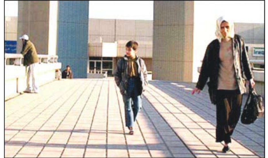
أم عراقية تراقف ابنتها في طريق العودة من المدرسة