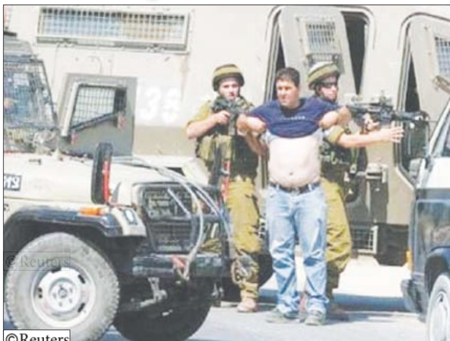
جانب من اعتقال الفلسطينيين على يد قوات الاحتلال