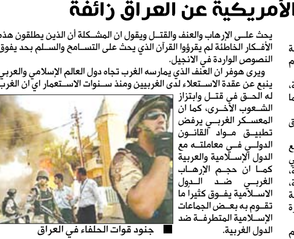
جنود قوات الحفراء في العراق

الرياض / منابعات : صدر مؤخرًا عن مكتبة جرير كتاب «ما لا يقوله الرجال للنساء» تأليف ماجي هاميلتون والذي يؤكد أن رجل اليوم يعيش معاناة لا تقل عن معاناة المرأة، فمنذ وقت مضى عندما بدأت تناضل من أجل حقها في التعبير والحياة والمشاركة، ولقد أصبح الرجل يئن الآن تحت وطأة الضغوط والتوقعات التي يفرضها عليه المجتمع وكل الأحكام المسبقة والقبول الجامدة عن الذكورة والرجولة. يتناول الكتاب حياة الرجل من المهد إلى اللحد ويبحث في الأسباب التي جعلت نظرنا إليه يشوبها الكثير من الخفاء وسوء الفهم و من ثم سوء التقدير. ينشا الطفل الذكر منذ صغره على الصلاة والجدل وكيث مشاعره وحسب خلوته وقلقه وهو ما يدفعنا ويندفعين إلى مجابهة مواقف صعبة لا قبل له بها منذ سن مبكرة للغاية بدءاً من مرحلة الطفولة ومروراً بالمرافقة وحتى سن النضج فالهرم. إن جعلنا بطبيعة الذكر هو ما زج الرجل في هذه الهوة