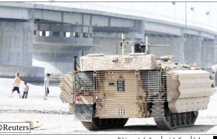
ديابة أمريكية في أحد شوارع مدينة الصدر

ذ / بغداد / 14 أكتوبر / رويترز / وكالات: قال وزير الدفاع العراقي عبد القادر العبيدي في تصريحات صحفية نشرت أمس في بغداد إن قواته عثرت على كميات كبيرة من أسلحة ثقيلة إيرانية الصنع أثناء عملية صولة الفرسان في البصرة جنوب العراق. ونسبت صحيفة (الصباح الجديد) إلى العبيدي قوله «إن أغلب الأسلحة الثقيلة تحتوي على إخطاء في أجهزة التصويب عند إطلاقها بما يؤثر بنسبة 90٪ على المواطنين الأبرياء و7٪ من القوات العراقية و3٪ من قوات متعددة الجنسيات». كما تحدث الوزير العراقي عن سيطرة على جميع أمحاء البصرة من قبل القوات الأمنية العراقية، مشيراً إلى أنه سيتم البدء بالمرحلة الثالثة من العمليات التي أطلق عليها «من أجل بصره آمنة