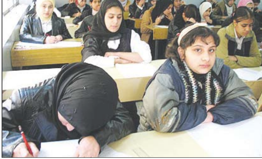
طالبات عراقيات في صف دراسي