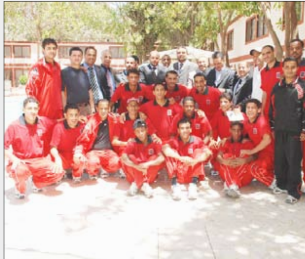
عباد أثناء لقائه أعضاء مجلس إدارة النادي وجهازه الفني والإداري واللاعبين

الثالثة في ذهاب البطولة، ليحصد الأهلي بهذا التعادل نقطته الثانية في المجموعة الآسيوية الثانية محتلاً الترتيب الثالث بفرق الأهداف عن الودحدات الأردني، فيما أضاف الصفاء اللبناني نقطته الخامسة في المركز الثاني بعد البنغال الهندي متصدر المجموعة برصيد ست نقاط.