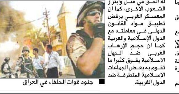
جنود قوات التحالف في العراق

العبيقة من المعاناة، فهو يحتاج إلى كل المساندة والدمع والحب. ان افتراضنا بأن الرجل القوة والقدرة المطلقة هو ما جعلنا لا نشعر بأن له جوانب ضعف ولحظات انهيار يمكن أن تؤدي بحياته. لقد تعلم الرجل منذ صغره كيف يتحمل في صمت ويجابه في جلد ويخفي كل قلقه ومخاوفه وهو ما يجعله عرضة لمواقف وصددمات لا قبل له بها. وحتى عندما يجابه الرجل بمثل هذه الصدمات فإنه لا يبادر بطلب النصح أو المساعدة