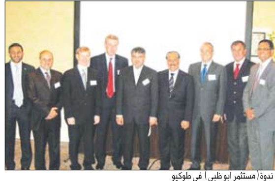
ندوة (مستثمر أبوظبي) في طوكيو

وأشار إلى ان «الدبلوماسي دورا كبيرا في تعزيز اقتصاد بلده من خلال نشاطه وديناميته في البلد الذي يمثل فيه بلاده، كما ان دورهما في فتح مجالات عديدة للاستثمار والتعاون الاقتصادي المشترك بين بلده والبلد الذي يعمل فيه». الاسكوا تتوقع 4 % ارتفاع الناتج المحلي الإجمالي للسعودية في 2008 الرياض/متابعات: وقال متوقع أن يسجل الناتج المحلي الإجمالي للمملكة نمواً بنسبة 4% بحلول نهاية العام 2008 على خلفية ارتفاع إنتاج النفط والنمو القوي للقطاع غير النفطي وزيادة الاستثمار الخاص والانفاق الحكومي القوي. وقالت دراسة حديثة أصدرتها لجنة الأمم المتحدة الاقتصادية والاجتماعية لغرب آسيا «الاسكوا» ان فائض الحساب الجاري للمملكة يعد الأعلى في دول مجلس التعاون الخليجي اذ يصل إلى 49% من مجموع فائض الحساب الجاري مقارنة بـ 25% للكويت و17% للإمارات العربية المتحدة و16.5% للبحرين. ونوهت بما حققته المملكة من تقدم ملحوظ في الإصلاحات الاقتصادية من أجل تنشجيع القطاع الخاص على الاستثمار.