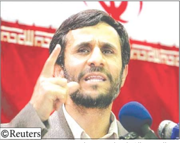
الرئيس الإيراني أحمدى نجاد

وقال الهام «عندما نفيت الشائعات لم أكن أعلم بشأن التغييرات». وجاءت حكومة أحمدى نجاد المحافظة إلى السلطة في عام 2005 بتعهد بإتخاذ نهج أكثر انفتاحاً على الاقتصاد العالمي. وقال نجاد في مقابلة مع قناة الجزيرة: «إننا نؤمن بالحرية الاقتصادية والحرية التجارية». وأضاف نجاد: «إننا نؤمن بالحرية الاقتصادية والحرية التجارية». وأضاف نجاد: «إننا نؤمن بالحرية الاقتصادية والحرية التجارية».