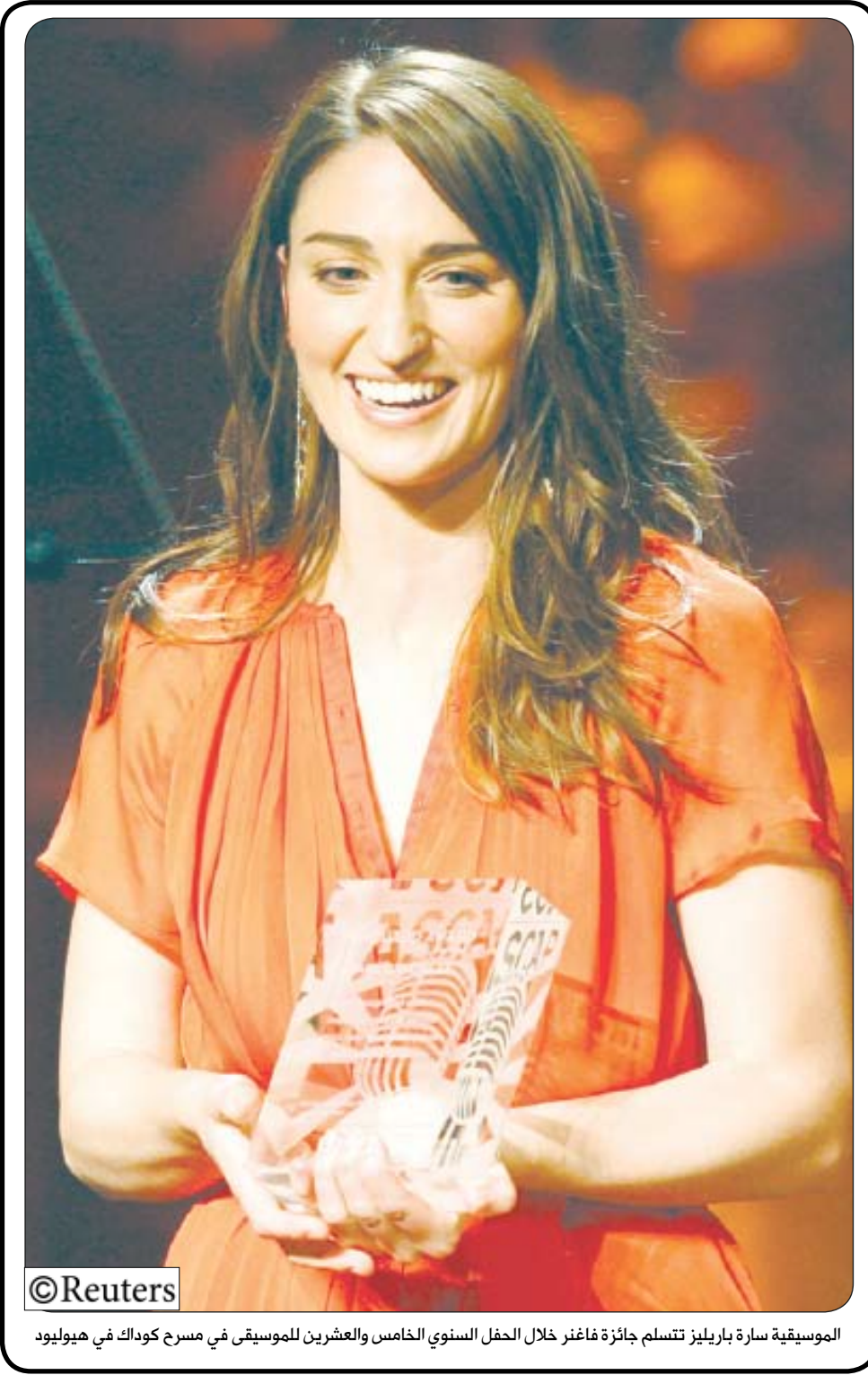
الموسيقية سارة باريليز تتسلم جائزة فاعتر خلال الحفل السنوي الخامس والعشرين للموسيقى في مسرح كوداك في هيويلود

صنعاء/متابعات: أكد الأستاذ نصر طه مصطفى نقيب الصحفيين اليمنيين بأن الأسرة الصحفية ستعلن خلال الأيام القليلة القادمة عن ميثاق شرف صحفي سيتم طرحه للنقاش مع زملاء المهنة.. داعياً في حوار موسع أجرته معه صحيفة «26سبتمبر» ونشرت جزاء الأول في عددها الصادر أمس جميع الصحفيين إلى التسلح بالقانوني والعمل على تعزيز وترسيخ الوحدة الوطنية، وكشف الأخطاء والممارسات التي أساءت وتسيء إليها ، باعتبار الصحافة كاشفة للأخطاء ويتوجب عليها تادية دورها الفاعل في المجتمع وبما يجعل منها سلطة رابعة بكل معنى الكلمة..