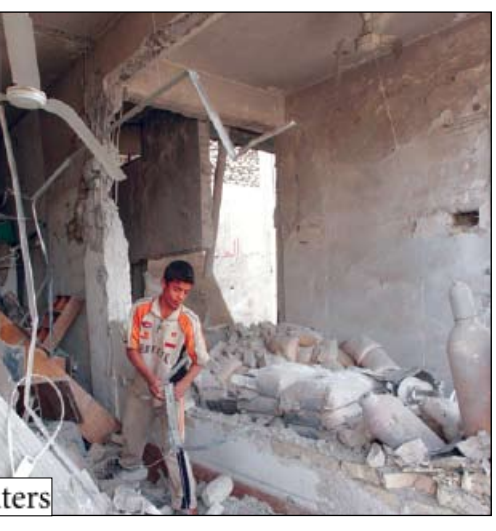
جانب من مخلفات الحرب في مدينة الصدر

العراق ريان كروكر قائلين إن المصالح الأمريكية ستكون في وضع أفضل من خلال تحويل نحو 160 ألف جندي أمريكي في العراق إلى المعركة ضد تنظيم القاعدة في باكستان وأفغانستان. وأعلن الجيش العراقي انه يزمع رفع الحظر على تسير السيارات في مدينة الصدر يوم السبت. ومنع الحصار السيارات من دخول أو مغادرة في الصدر الذي يقع في شرق بغداد ويبلغ عدد سكانه مليوني نسمة. وفرض حظر تسير السيارات الذي شمل أنحاء بغداد يوم أول من أمس لمنع انتشار العنف في الذكرى السنوية الخامسة لسقوط العاصمة العراقية بغداد في أيدي القوات الأمريكية. ورغم ذلك قالت مصادر أمن عراقية أن نحو 23 شخصاً قتلوا وأن الولايات المتحدة أعلنت مقتل خمسة جنود آخرين من القوات الأمريكية في اشتباكات مدينة الصدر.