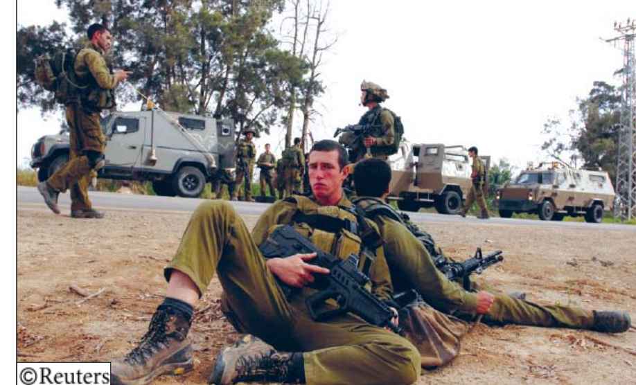
استعداد إسرائيل للاغارة على غزة

حساباتها مع حركة حماس)، وأضاف أن تل أبيب ستختار «الزمان والمكان المناسبين» للرد على العملية. وقال فيلناتي في تصريح لإذاعة الجيش الإسرائيلي أمس «لو لم تكن حماس تريد هذا الهجوم لما حدث بالتاكيد». وكانت وزيرة الخارجية الإسرائيلية تسيبي ليفني قد هددت المقاومة بالقيام بما وصفته أعمالاً انتقامية لم تحدثها. وقالت في بيان إن حركة حماس «تتحمل مسؤولية كل ما يستتبعه ذلك». وقال التصريحات الإسرائيلية تهدف إلى تهينة المناخ لحملة عسكرية إسرائيلية جديدة ضد قطاع غزة. وأضاف «نحذر الاحتلال الإسرائيلي من الإقدام على أي حماقة من هذا النوع ولدينا كل الثقة والقدرة على إفضال هذا العدوان».