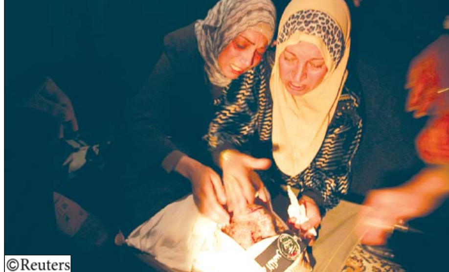
أم فلسطينية تبكي على ابنها القتيل

وتبنت سرايا القدس الجناح العسكري لحركة الجهاد الإسلامي ولجان المقاومة الشعبية وكتائب المحامين التابعة لحركة التحرير الوطني الفلسطيني (فتح) في بيان، ذلك الهجوم الذي وصف بأنه نوعي. وبعد الهجوم بقليل شنت طائرات حربية إسرائيلية غارة جوية على سيارة في حي الزيتون شرق غزة، وذكرت مصادر طبية فلسطينية أن ثلاثة من ركبها أصيبوا بجروح أحدهم إصابته خطيرة. وفي نفس الإطار أشار مصدر إلى أن فلسطينيين استشهدوا في غارة إسرائيلية على حي الشجاعية، وذكر شهود عيان أن أحد الشهود يحمل في محمله للوقود بالمنطقة، والأخر ينتمي للمقاومة. كما استشهد أمس الأول ثلاثة مدنيين فلسطينيين بينهم طفلان جراء قذيفة دبابة إسرائيلية سقطت في حي منزل في حي الشجاعية بغزة. وسبق ذلك استشهاد مقاوم من كتائب القسام التابعة لحماس، ومقتل جندي إسرائيلي في اشتباكات جنوب قطاع غزة على الحدود مع إسرائيل.