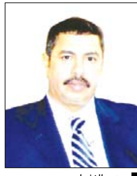
صنعا/سيا؛ قال وزير النفط والمعادن خالد محفوظ بحاج أن وزارة النفط ستوقع مبدئياً مطلع الأسبوع المقبل على ثنائي اتفاقيات بتروولية مع الشركات الفائزة في إطار المناقصة الدولية الثالثة وذلك بعد أن وافق عليها مجلس الوزراء.

وأكد الوزير بحاج لوكالة الأنباء اليمنية (سبأ) أن الوزارة تجري حالياً عملية إعداد استمارات العطاء للشركات المتقدمة للمنافسة الدولية الرابعة وذلك بحضور مندوبين عن تلك القطاعات، متوقعاً أن يتم تسليم تلك الاستمارات نهاية الشهر الجاري. وأشار إلى أن وزارة النفط والمعادن بدأت منتصف الشهر الماضي بتحليل عروض خاصة بـ 11 امتيازاً بحرياً بعد حصولها على بيانات المسح الزلزالي وبعض المعلومات الخاصة بتلك القطاعات. وتوقع بحاج إعلان النتائج النهائية للشركات الفائزة بامتيازات التنقيب في القطاعات البحرية نهاية يوليو القادم.