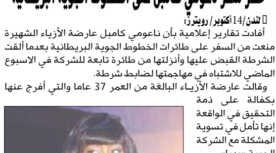
عارضة الأزياء ناعومي كامل خلال مؤتمر صحفي في برلين

لندن / 14 أكتوبر / رويترز: أفادت تقارير إعلامية بأن ناعومي كامل عارضة الأزياء الشهيرة منعت من السفر على طائرات الخطوط الجوية البريطانية بعدما ألت شرطه القبض عليها وأزيلتها من طائرة تابعة للشركة في الاسبوع الماضي للاشتباه في مهاجمتها لضابط شرطة. وقالت عارضة الأزياء البالغة من العمر 37 عاما والتي أفرج عنها بكفالة على ذمة التحقيق في الواقعة إنها تأمل في تسوية المشكلة مع الشركة الجوية «وديا». وأضافت الناطقة باسم كامل في لندن لندسوني تسافر على طائرات الخطوط الجوية البريطانية منذ 30 عاما تقريبا وكانت عميلة جيدة. وهي تأمل في أن يتم تسوية الأمر «وديا». وتجع الشركة البريطانية بالمشاكل بسبب الأنظمة التكنولوجية الحديثة الخاصة بإجراءات السفر للمسافرين والتعامل مع الأمتعة في الصالة الجديدة التي تكلفت 4.3 مليارات جنيه استرليني (8.6 مليارات دولار). والفيت مئات الرحلات وفقدت عشرات الآلاف من الحقايب. الجدير بالذكر إن كامل قد قضت سابقا خمسة أيام في مسح الأضياف كجزء من عقوبة خدمة مجتمع في نيويورك العام الماضي كما أمرت بحضور دورات بشأن كيفية التحكم في الغضب بعدما قذفت مدبرة منزلها بهاتف محمول أثناء خلاف على سرال جينز.