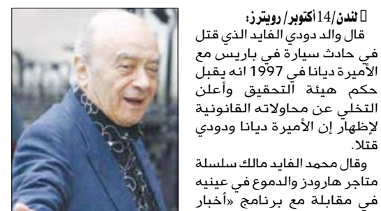
محمد الفايد أمام مقر المحكمة العليا في لندن

لندن / 14 أكتوبر / رويترز: قال والد دودي الفايد الذي قتل في حادث سيارة في باريس مع الأميرة ديانا في 1997 انه يقبل حكم هيئة التحقيق وأعلن التخلي عن محاولاته القانونية لإظهار إن الأميرة ديانا ودودي قتلتا. وقال محمد الفايد مالك سلسلة متاجر هارودز والدموع في عينيه في مقابلة مع برنامج «أخبار العاشرة» على شاشات محطة «إي تي في» التلفزيونية مساء الثلاثاء الماضي «هذا وكفى». وأضاف انه يتخلى عن معركته القانونية من أجل نجلي ديانا الأميرين ويليام وهاري. وقال «اترك الباقي لله للثأر لي.. لكنني لن افعل أي شيء آخر».