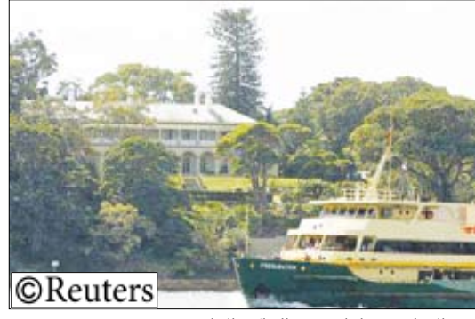
العبارة تمر امام قصر الحاكم العام

سيدني /14 أكتوبر/ رويترز: قفز سائح بملابسه الداخلية من فوق عبارة في سيدني وسبح إلى قصر الحاكم العام الأسترالي المطل على البحر. وتمكن السائح من دخول القصر كما سبح في حمام السباحة قبل القاء القبض عليه مما أثار جدلاً بشأن إجراءات الأمن. وأدهش الرجل ركاب العبارة بخلع ملابسه والقفز في المياه ليلعب 600 متر وخلفه زوارق شرطة المسطحات المائية. وتسلق الرجل بعد ذلك أسوار القصر لمواجهة لناد الأوبرا. وتجدر الإشارة إلى أن مقر إقامة رئيس الوزراء الأسترالي كيفين رود مجاور لقصر الحاكم العام. وقالت متحدثة باسم الشرطة لرويتز «دخل القصر للهروب من شرطة المسطحات المائية ثم سبح في حمام السباحة حتى ضبطته الشرطة.» ويتيمز القصر المؤلف من دورين ويعود بتاريخ يناهه إلى عام 1845 بكترة شرفاته ومناظره المطل على جسر هاربرو بريدج وما حوله. والقصر هو مقر إقامة في سيدني لممثل الملكة في أستراليا. واستضاف القصر الرئيس الأمريكي جورج بوش وزعماء آخرين خلال قمة آسيا والمحيط الهادئ في العام الماضي وكثيراً ما أقامت فيه الملكة إليزابيث خلال زيارتها لأستراليا. ولم يكن الحاكم العام مايكل جيفري ولا رئيس الوزراء كيفين رود في مسكنيهما في ذلك الوقت. وقالت الشرطة إن الرجل (45 عاماً) وهو من ولاية كوينزلاند تحول بالحدائق قبل نزوله لحمام السباحة حيث ضبطته الشرطة بعد ذلك بدقائق.