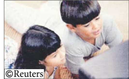
الأطفال يقضون ساعات أمام التلفزيون