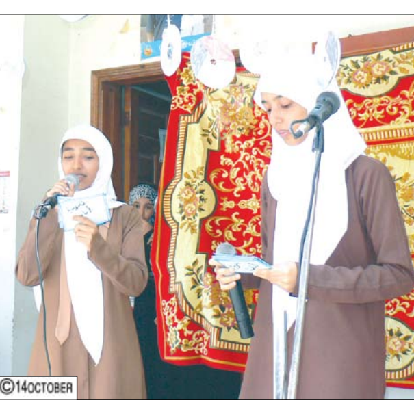
عـدن / محمد فؤاد أقيم أمس بثانوية باكتير بمديرية صيرة حفل بمناسبة الاحتفال باليوم المدرسي نظمته إدارة ثانوية أبان . وفي الحفل الذي بدأ بإي من الذكر الحكيم والقيت عدد من الكلمات من إدارة المدرسة ألقته