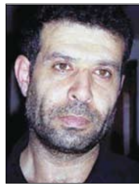
الشاعر نوري الجراح

صرخة البحر. نزلنا ) ومشيئا في جوار الماء ( وصلت الموجة ولحست الذين همك ) ومن وراء كنتك ( كان دم الظهيرة يقطر ) ويسود والشاطلي يتفرج. وصدرت أعمال الجراح في مجلدين من 960 صفحة عن المؤسسة العربية للدراسات والنشر. ويهدها «إلى سهام واية وراهي وأصقائي الغرياء. هنا صيف هارب من صيف قديم هارب» حيث يقيم الشاعر في لندن منذ سنوات. والجراح في المقدمة يصف الشاعر بأنه متطرف انتحاري «انه كشاف غوامض وغواص في وجود يطل مجهولا وعصيا على الكشف وهو في غومسه يندفع في غمامة تأخذ شطر الخطر وتهدد بالاعودة. ولا يتحقق الشاعر الا في تلك