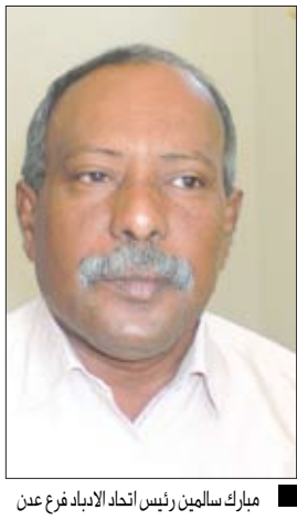
مبارك سالمين رئيس اتحاد الأدباء فرع عدن