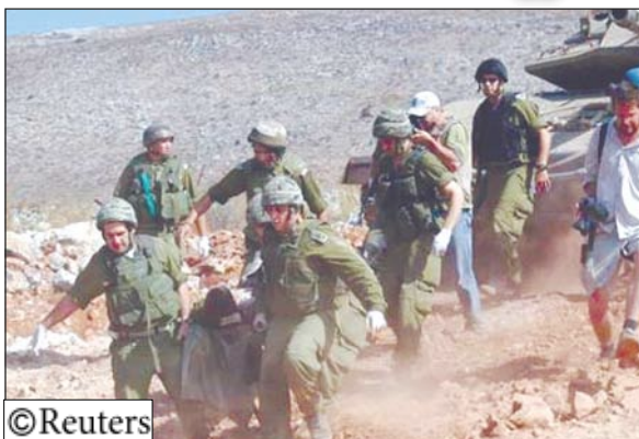
جانب من المناورة الإسرائيلية

وأوضح باراك أن «الجهة الشمالية تتسم بحساسية خاصة لكن ليست لدينا أي نية لتسبب بدمهور (عسكري) والجناب الآخر يعرف ذلك»، لكنه شدّد على «إننا مستعدون لمواجهة أي تطور». على صعيد آخر أعلن رئيس دائرة المفاوضات في منظمة التحرير الفلسطينية صائب عريقات أمس الأحد أن الرئيس الفلسطيني محمود عباس سيبيلغ رئيس الوزراء الإسرائيلي يهود وأولمرت خلال لقائهما اليوم الاثنين أن إسرائيل لم تنفذ سطرًا واحدًا من التزاماتها في خارطة الطريق. وقال عريقات إن عباس سيؤكد أن إسرائيل «لم تنفذ سطرًا واحدًا من التزاماتها كما حددها خارطة الطريق إذ لم توقف الاستيطان ولم تطلق سراح المعتقلين ولم ترفع الحواجز». وأضاف أن عباس وأولمرت سيبذلان أيضا سلسلة قضايا أبرزها «التهنئة ورفع الحصار الإسرائيلي عن قطاع غزة ومراجعة ما وصلت إليه عملية السلام في ما يتعلق بقضايا الوضع النهائي». واجتماع عباس وأولمرت اليوم هو الأول بينهما منذ أعلن عباس تعليق المفاوضات مع الجانب الإسرائيلي إثر الهجمات التي نفذتها إسرائيل على قطاع غزة في مارس الفائت وأدت إلى مقتل عشرات الفلسطينيين. وعمّا إذا كان الجانب الفلسطيني يأمل تحقيق شيء من اللقاء قال عريقات «من السابق لأوانه الحديث عن نتائج».