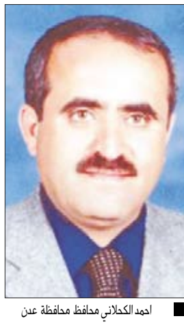
احمد الكحلاني محافظ محافظة عدن