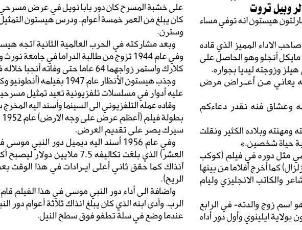
الممثل الأمريكي تشارلتون هيستون