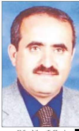
أحمد الكحلاني محافظ عدن