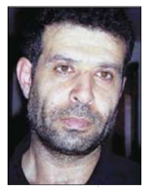
الشاعر نوري الجراح

صرخة البحر.. نزلنا / ومشيئا في جوار الجاه / وصلت الموجة ولحست / قدمك / ومن وراء كنتك / كان دم / الظهيرة يقطر / ويسود / والشاطئ ينترج.. وصدرت أعمال الجراح في مجلدين من 960 صفحة عن المؤسسة العربية للدراسات والنشر، ويهدتها (إلى سهام واية ورامي واصفانتي الغريب.. هنا صيف هارب من صيف قديم هارب، حيث يقبع الشاعر في هبة أو جائزة يفوز بها منتصراً على الموت «والغريب أن الشاعر سرعان ما يعرض عن هذه المكافأة ويبدو كما لو كان ينتكر للعبة ويأمنها إذ يتحول انتباهه عنها وينتهي لحدث آخر». ويقول الجراح في مقاطع من (قصيدة حب).. «في الميلاد، كتفي ما في مسلكه من علامات لطف» مضيقاً أن الشعراء الحقيقيين هم الذين كتبوا قصائدهم، وهجست أرواحهم بالموث وراوتهم فكرة الانتراج مع كل قصيدة أو كلمة. المقدمة هي جزء من نص محاضرة حول الشعر الفصيح عام 1991 وفيها يقول « كل شعر يذكرنا بنظير أو يحيلنا على مرجع له انما نعتبره خلل فاح فيه مقلته» مضيقاً أن القصيدة تمثل للشاعر هبة أو جائزة يفوز بها منتصراً على الموت «والغريب أن الشاعر سرعان ما يعرض عن هذه المكافأة ويبدو كما لو كان ينتكر للعبة ويأمنها إذ يتحول انتباهه عنها وينتهي لحدث آخر». ويقول الجراح في مقاطع من (قصيدة حب).. «في الميلاد، كتفي