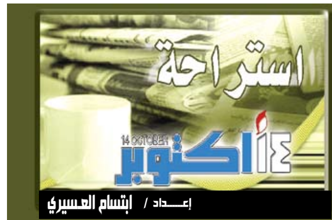
إعداد / إنشام العسيري

موسكو / متابعات : أعلن وزير تكنولوجيا المعلومات والاتصالات الروسي ليونيد ريمان أن بلاده ستحقق قريبا طفرة كبيرة في مجال تطوير خدمة الإنترنت اللاسلكية. وقال ريمان في حديث للصحافيين على هامش منتدى الإنترنت في روسيا إن ذلك سيحقق في العام المقبل. ونسبت وكالة الأنباء الروسية إلى ريمان إشارته إلى وجود عدد من