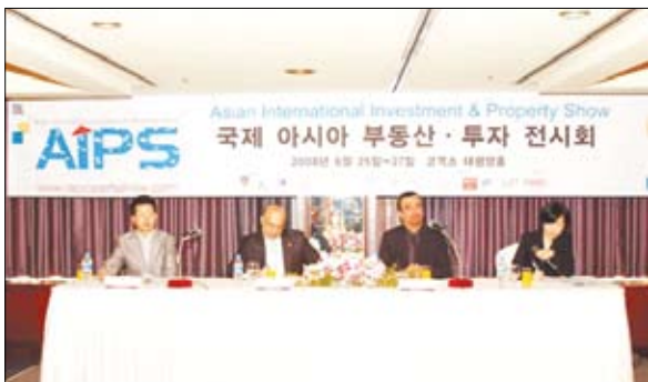
المعرض العقاري الآسيوي في سيؤول

الكوري الجنوبي /كوكيس/ بهدف إنجاح هذه الفعالية المهمة وتسويقها في كوريا الجنوبية وفي منطقة جنوب وشرق آسيا. وأمام وجود مشاركة قوية لعدد من شركات تطوير العقارات والأعمال والمصارف التجارية والمتخصصة والأهلية من دولة الإمارات ودول الخليج والدول العربية الأخرى فضلاً عن شركات من شبه القارة الهندية وشرق آسيا وأوروبا والولايات المتحدة وأستراليا. وأوضح أن هذه الفعالية تترامن مع المفردة التي تشهدها الاستثمارات العقارية في منطقة الخليج وشبه القارة الهندية ومنطقة جنوب شرق آسيا بالإضافة إلى أنحاء متفرقة من أوروبا وأفريقيا.