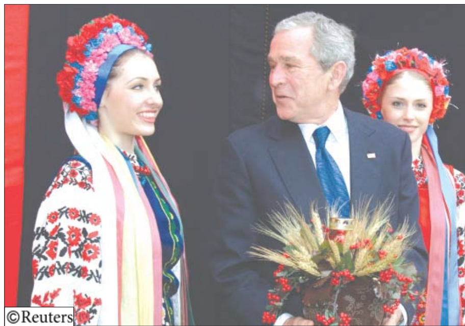
الرئيس الأمريكي جورج بوش في بوخارست

دول الحلف بنفسها عن مناطق القتال العنيف- تبادلًا للاتهامات عبر الأطلسي ومن المتوقع أن تظل مصدرا للتوتر في موع الحلف التي تبدأ اليوم.