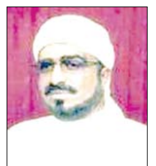
الشيخ / أنيس الحبشي

الإرشاد الديني المأزوم هو ذلك الخطاب الذي لا يستوي على قوائم صحبة من العقل والمنطق والضمير .. وهو خطاب يزداد اليوم هبوطاً وتأخرًا .. يتجلى ذلك إنما قليباً نظرك بين الخطباء والوعاظ وكتاب الفكر الإسلامي باتجاهاته المختلفة! معظم الخطباء إلا ما ندر منهم ، يزيد زبد السيل الجارف ، أو يخور خوار البقر «!»، وهو يخطب بتشنج عصبي يوجي يخلل نفسي يستوجب عرضه على الطبيب المختص للمعالجة «!»، فضلاً عما يسببه هذا الصنف من أذى السامع بتوتير أعصابه، وإزعاج للفاعيين في بيوتهم من النساء والأطفال والمرضى والمعذورين «!» .. ومنهم من يتناول الساسة والسياسة بأفزع الألفاظ الممجوجة فالحاكم الفلاني ضال وأبو مازن بهائى .. والوالكي شيعي .. وبقية الحكام العرب والمسلمين ما يستر الله من الأوصاف الموقوتة .. وحكام الداخل أشد سوءاً وأقبح حالاً من هؤلاء جميعاً (!) .. وكل ذلك في منبر للإرشاد ينبغي ألا يصدر منه إلا دين وإيمان «!» وكل مساجدنا اليوم لا تخلو من التقسيم الحزبي والمذهبي وربما العرقي في القريب الآلق «!»، فهذه مساجد للصوفية .. وتلك للسلفية أتباع الحجوري الذين انقسموا مؤخرًا إلى «شمال وجنوب» .. وتلك للسلفية أتباع أبي الحسن المصري .. وتلك للجمعيات بأنواعها وأشكالها والوانها وأحزابها «!» .. فتلك لحزب الإصلاح «الإسلاموي» .. وتلك للشيعه وأخرى للبهرة وأخرى غليظاً! وأخرى وأخرى ولله في مذاهب خلقه شؤون!!