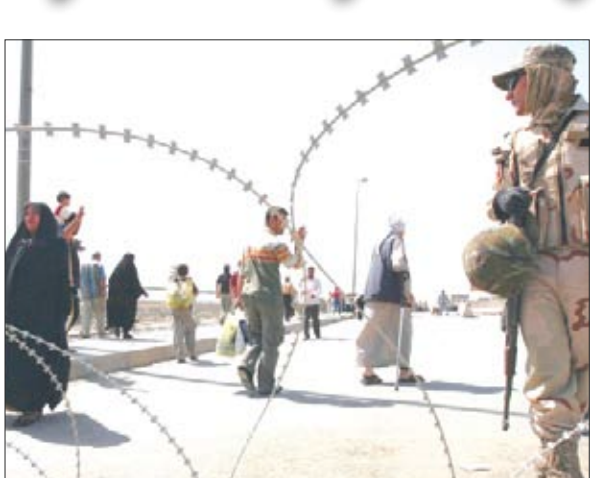
جانب من مظاهر الحياة في البصرة بعد الاشتباكات بين انصار الصدر والقوات الأمريكية والعراقية

الهيئات المحلية في الجنوب. وقالت الحكومة أن الحملة التي شنتها في البصرة محاولة لتأكيد سلطة الدولة في مدينة تشهد غيابيا للقانون.