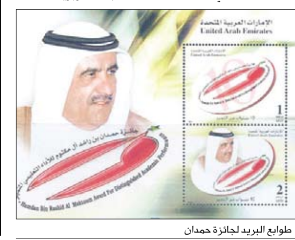
طوابع البريد لجائزة حمدان

يذكر أن جائزة حمدان بن راشد آل مكتوم للأداء التعليمي المتميز قد تأسست في دبي عام 1998 بموجب القرار الذي أصدره سمو الشيخ حمدان بن راشد آل مكتوم نائب حاكم دبي وزير المالية إسهاماً منه في دعم قطاع التربية والتعليم وتكريماً للمتميزين في كافة المجالات التربوية.