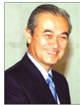
عبدالله أحمد بدوي

ان رئيس وزراء ماليزيا عبدالله أحمد بدوي نفى أمس الأربعاء الحديث عن انه سيستقيل.