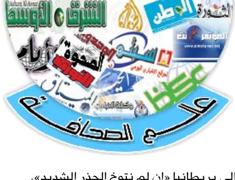
إلى بريطانيا «إن لم نتوخ الحذر الشديد».

وذكرت صحيفة (ديلي تلغراف) البريطانية أمس الأربعاء نقلا عن صحيفة يابانية أن إسرائيل اعترفت لأول مرة بأن الغارة الجوية التي نفذتها في سوريا العام الماضي استهدفت منشأة نووية بنيت بمساعدة كوريا الشمالية.