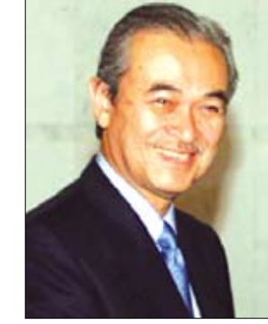
عبدالله أحمد بدوي

ان رئيس وزراء ماليزيا عبدالله أحمد بدوي نفى أمس الأربعاء الحديث عن انه سيستقيل. ووجه البعض نداءات إلى عبد الله لكي يستقيل بعد أن منى الائتلاف الحاكم بأسوأ نتكاسة انتخابية في 50 عاما في الثامن من مارس. وخسر الائتلاف الانتخابات في خمس ولايات لصالح المعارضة كما خسر غالبية الثلثين التي كان يتمتع بها في البرلمان. وأثار الحديث -عن ان عبدالله قد يتعرض لضغوط كي يستقيل- شكوكا سياسية وأصاب المستثمرين بالهزات. وقال رئيس الوزراء للوكالة «إنني هنا. إنهم يصنعون كل التكهات بأنني أريد أن اهرب وأنتي استقلت»، وأضاف وهو يقول مجددا أن الائتلاف ما زال يتمتع بأغلبية قوية «لماذا أستقيل؟ لماذا يجب أن اهرب من المسؤولية التي عهدت إلي؟».