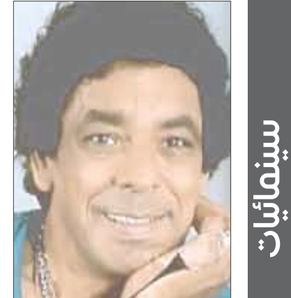
الفنان محمد منير

يسعد الفنان محمد منير لبطولة الفيلم السينمائي الجديد "خالي صفيه والدير" قصة بهاء طاهر وسيناريو وحوار ناصر عبد الرحمن، وأخراج أسماء البكري. تدور أحداث الفيلم حول الحياة والروابط الاجتماعية الأصيلة بين المسلمين والمسيحيين في فترة الخمسينيات والستينيات، حسب صحيفة "الأهرام" المصرية. ويشارك منير بطولة "خالي صفيه والدير" حنان مطاوع، سلوى خطاب، خالد الصاوي، وعزت أبو عوف، ومن المقرر أن يتم التصوير بين الأقصر وأسوان والقاهرة. يذكر أن قصة هذا الفيلم تم تقديمها منذ سنوات في مسلسل تليفزيوني يحمل نفس الاسم من إخراج إسماييل عبد الحافظ و بطولة ممدوح عبد العليم.