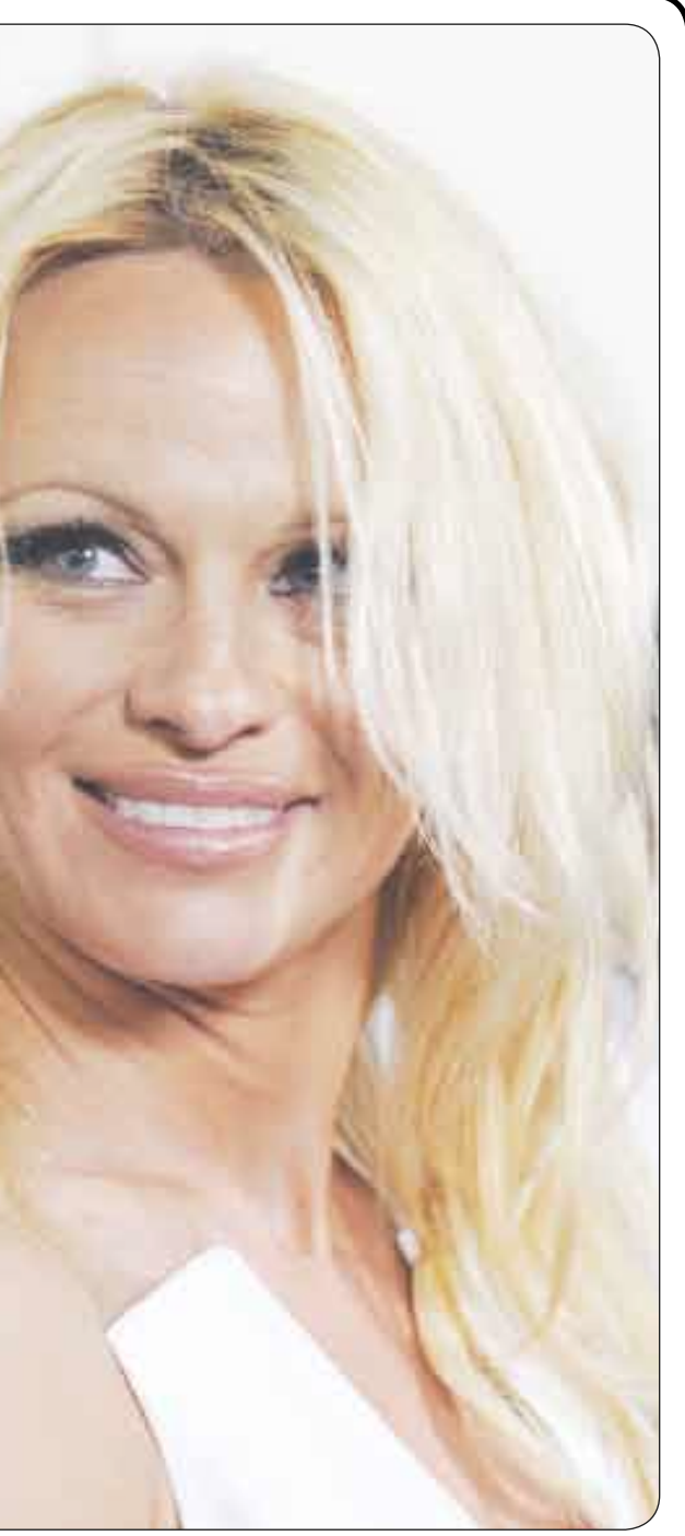
الممثلة الأمريكية «بامبلا اندرسون» أمام عدسات الصحفيين في حفل افتتاح فلم «البطل الخارق» في لوس انجيليس امس الأول.

أعد المند عبد السلام الحسيني بأن المهرجان كان رائعا بكل المقاييس ونظرا لبساطة