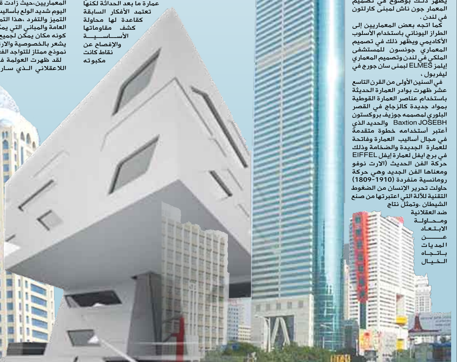
صورة معمارية حديثة تظهر عمارة حديثة مع استخدام مواد جديدة كالزجاج في القصر البلوري لمصممه جوزيف بروكستون Baxton JOSEBH والحديد الذي اعتبر استخدامه خطوة متقدمة للعمارة الجديدة والضخامة وذلك في برج إيفل لعمارة إيפל EIFFEL حركة الفن الحديث (الارت نوفو) ومعناها الفن الجديد وهي حركة رومانسية منفردة (1910-1809) حاولت تحرير الإنسان من الضغوط التقنية للآلة التي اعتبرتها من صنع الشيطان، وتمثل نتاج ضد العقلانية ومحاولة الابتعاد عن المدييات باتجاه الخيال

في الستين الأولى من القرن التاسع عشر ظهرت بوادر العمارة الحديثة باستخدام عناصر العمارة القوطية بمواد جديدة كالزجاج في القصر البلوري لمصممه جوزيف بروكستون Baxton JOSEBH والحديد الذي اعتبر استخدامه خطوة متقدمة للعمارة الجديدة والضخامة وذلك في برج إيفل لعمارة إيפל EIFFEL حركة الفن الحديث (الارت نوفو) ومعناها الفن الجديد وهي حركة رومانسية منفردة (1910-1809) حاولت تحرير الإنسان من الضغوط التقنية للآلة التي اعتبرتها من صنع الشيطان، وتمثل نتاج ضد العقلانية ومحاولة الابتعاد عن المدييات باتجاه الخيال