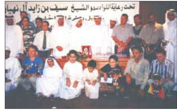
زين في الإمارات

فقال عدة شهادات تقديرية لمهاراته وإبداعاته كلاعب يمني مقدر وكرم في عدة مشاركات في الإمارات.