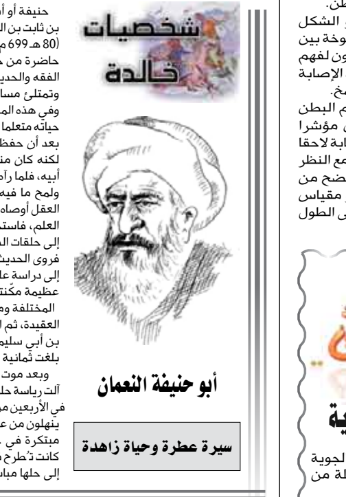
أبو حنيفة النعمان سيرة عطرة وحياة زايدة

أبو حنيفة النعمان بن ثابت بن النعمان بن زوملي المولود سنة (80 هـ/699 م). ولد في الكوفة وكانت آنذاك حاضرة من حواضر العلم، تخرج بحفقات الفقه والحديث والقراءات واللغة والعلوم، وتمثلت مساجدها بنسوخ العلم وأتمته، وفي هذه المدينة قضى أبو حنيفة معظم حياته متعلماً وعالماً، وتردد في صباه الفكر بعد أن حفظ القرآن على هذه الحفقات، لكنه كان منصرفاً إلى مهنة التجارة كغيره من أبناء عصره، فعمل بالتجارة، وولج ما فيه من مزايا الكسب ورواحته العقل أوصاه بمجالسة العلماء والنظر في العلم، فاستجاب لرغبته وأصرف بجمته إلى حلقات الدرس وما أكثرها في الكوفة، فروى الحديث ودرس اللغة والأدب، واتجه إلى دراسة علم الكلام حتى برع فيه براعة عظيمة مكنته من محادثة أصحاب المرائل المختلفة ومجادلتهم في بعض المسائل العقيدة، ثم انصرف إلى الفقه وازمجد حماد بن أبي سليمان، وطلقات ملازمته له حتى بلغت ثمانية عشر عاماً. ويعد موت شيخه حماد بن أبي سليمان التي رياسته حلقة الفقه إلى أبي حنيفة، وهو في الأربعين من عمره، والثقل جوله للأبيد بنهلون من علمه وفقهه، وكان له طريقة منكرة في حل المسائل والقضايا التي كانت تطرح في حلقاته، فلم يكن يعمد هو إلى حلها مباشرة، وإنما كان يطررها على