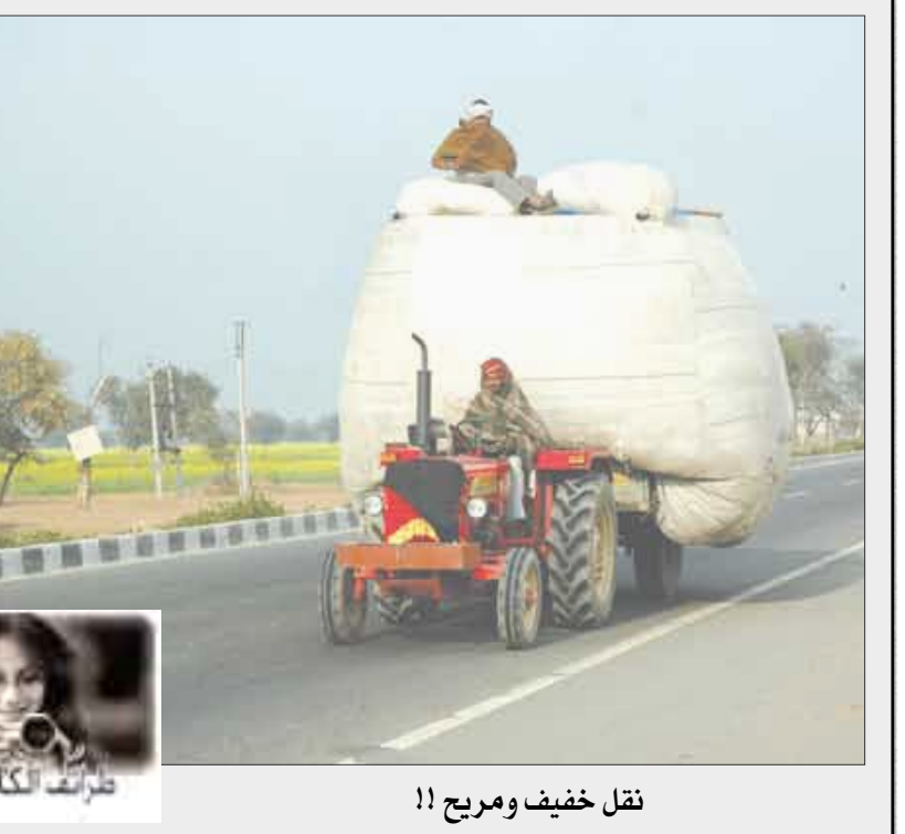
نقل خفيفاً ومريحاً !!

أفقياً: أديبة لبنانية عاشت في مصر امتازت بثقافة عربية وغربية ساهمت في النهضة الأدبية وكانت دارها ندوة للأدباء يعقدون فيها مجلساً إسبوعياً من آثارها (باحثة البادية) - محافظة يمنية مجلة يمنية - من الطيور - أول مدينة أنشأها المسلمون بالغرب شهر ميلادي - ناقوس مدخل - وديع كف - وقت - يستخدم للكتابة. نقيض حلال - فريدين. حمام بري - اللثني - أبو البشر. اسم علم مذكر - شاطئ - كفاء. من أصنام الجاهلية - تيسر. ضياء - شب - من الثمار. يصلي بالناس - بط - بصاحب الرعد. عمود يومي في الصحيفة (14 أكتوبر) - طليق. عمودياً: قناديل - قل. بحر - لاعب كرة قدم برازيلي عالمي. العنب الملقف - رجاء - الريح الطبية. خير بركة - طائر يستخدم رمز للسلام - في حل العدد الماضي