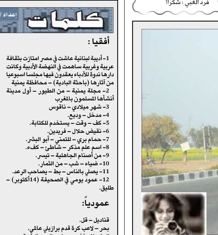
نقل خفيف ومرح !!

متقاطعة أفقياً: 1- أديبة لبنانية عاشت في مصر امتازت بثقافة عربية وغربية ساهمت في النهضة الأدبية وكانت دارها ندوة للأدباء يعقدون فيها مجلساً اسبوعياً من آثارها (باحثة البادية) - محافظة يمنية 2- مجلة يمنية - من الطيور - أول مدينة أنشأها المسلمون بالغرب 3- شهر ميلادي - ناقوس 4- مدخل - ودع 5- كف - وقت - يستخدم للكتابة 6- نقبض - حلال - فريدين 7- حمام بري - اللبني - أبو البشر 8- اسم علم مذكر - شاطئ - كفاء 9- من أصنام الجاهلية - تيسر 10- ضياء - شب - من الثمار 11- يصلي بالناس - بط - يصاحب الرعد 12- عمود يومي في الصحيفة (14 أكتوبر) - طليق عمودياً: قناديل - قل - بحر - لاعب كرة قدم برازيلي عالمي - العنب الملطف - رجاء - الرياح الطيبة - خير وبركة - طائر يستخدم رمز للسلام - في حل العدد الماضي