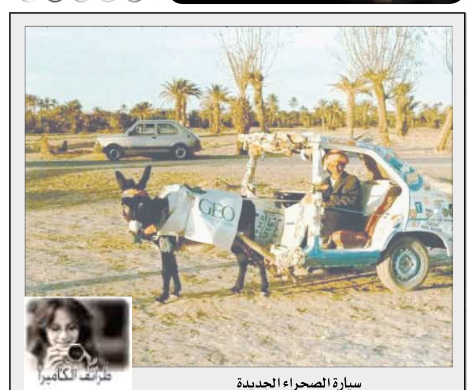
سيارة الصحراء الجديدة