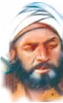
أبو جعفر المنصور