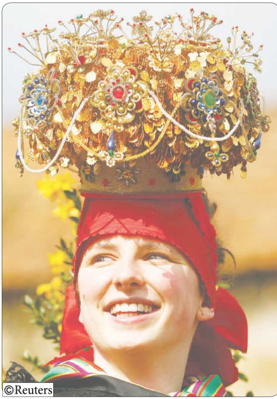
أمرأة تلبس قبعة الزواج الفرائدونية التقليدية أثناء سباق الخيل الجوري التقليدي في عيد الفصح في قرية بلوارين الشمالية في المنيا، حيث إن هذه التقاليد مازالت تطبق منذ القرن السادس عشر عندما كان المزارعون يقومون بمباركة أحصنتهم.

البرنامج شارك فيه 125 خطيباً وهدف إلى تعريفهم بمخاطر ظاهرة تهريب الأطفال وإطلاعهم على حجمها والأضرار المترتبة عليها وسبل معالجتها إلى جانب وضع الآلية المناسبة لتنفيذ حملة التوعية الشاملة التي ستندف من خلال خطب الجمعة مع منتصف أبريل القادم لما من شأنه إحراز تقدم في الحد من هذه الظاهرة السلبية .