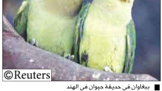
ببغوان في حديقة حيوان في الهند

لندن 14 أكتوبر / رويترز: تغرد الطيور عند قدوم فصل الربيع بفضل تفاعل حيوي يحدث مع مقدم الأيام الأطول نهاراً.