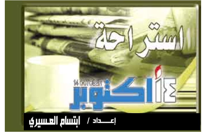
إعداد / إنشام العسيري

و50% من المدخنات للماريجونا لا يتوقفن طوال فترة الحمل. وقالت بايلي إن الأشهر الأولى بعد الولادة هي أساسية للتدخل مع الأمهات، فعلى سبيل المثال عديدات هن من قمن بالعمل الصعب وأقلعن عن التدخين خلال الحمل لذا من واجبنا أن ندعم هذا الجهد حتى يتوقفن عن التدخين بشكل دائم، لكن إذا كان الأب مدخناً أو يشرب الكحول، فالأرجح أن تعاود الأم التدخين والشرب. يشار إلى أن البيانات التي استخدمت في الدراسة أتت من مشروع التنمية الاجتماعية في سياتل الذي يراقب تطور 808 أشخاص من الطفولة حتى بلوغ مرحلة الرشد.