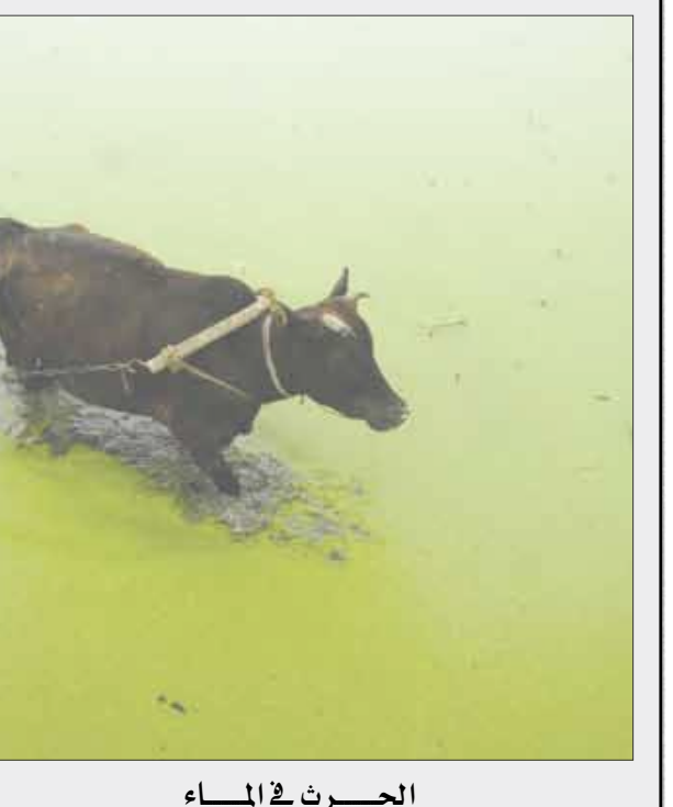
الحراثة في الماء

أفقياً: 1- شاعر اشتهر بالغزل في العصر الأموي تشبب بأم البنين زوجة الوليد بن عبد الملك فأمر الوليد بدفنه حياً - ماضي يرن. 2- مقاطعة بريطانية قاعدتها أكستر - حيوان مفترس - قسم. 3- كف - أحرف متشابهة - للتعريف - سقي النباتات. 4- متشابهان - حرف نصب (معكوسة) - من المعالم الأثرية لبلادنا. 5- جزيرة في خليج نيويورك - كتمان. 6- نيام - حرف جر. 7- مدينة يمنية - عاصمة عربية. 8- من الحواس الخمس - شهر ميلادي - غير مطلوب. 9- عاصمة آسيوية. 10- حرف عطف - لهو. 11- من نجوم المنتخب السعودي لكرة القدم. 12- عقيدة - تادر. عمودياً: 1- أمانة - لون الحداد في الصين. 2- حيوان برماني - أداة جزم - للنفي.