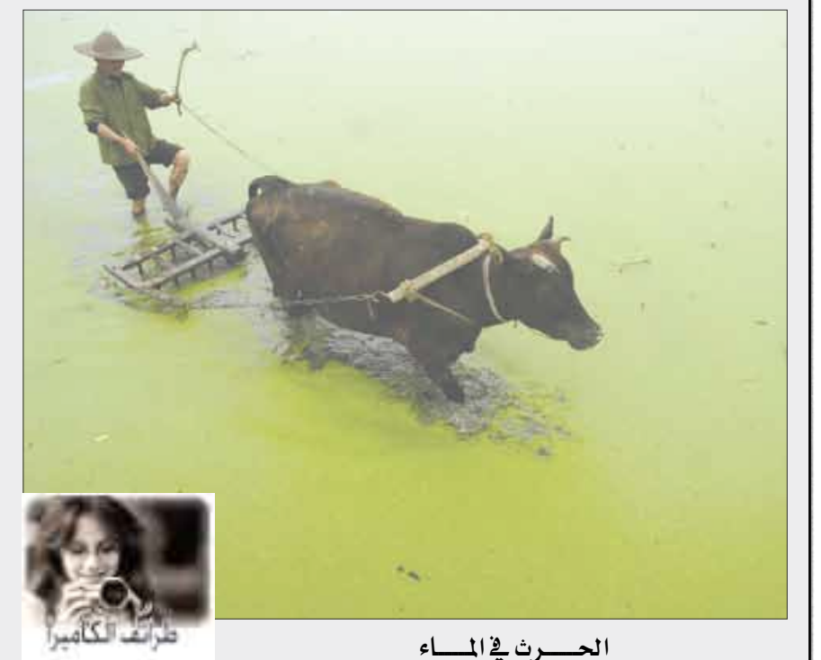
الحراثة في الماء

أفقياً: 1- شاعر اشتهر بالغزل في العصر الأموي تشبب بأم البنين زوجة الوليد بن عبد الملك فأمر الوليد بدفنه حياً - ماضي يرن. 2- مقاطعة بريطانية قاعدتها أكستر - حيوان مفترس - قسم. 3- كف - أحرف متشابهة - للتعريف - سقي النباتات. 4- متشابهان - حرف نصب (معكوسة) - من المعالم الأثرية لبلدنا. 5- جزيرة في خليج نيويورك - كتمان. 6- نيام - حرف جر. 7- مدينة يمنية - عاصمة عربية. 8- من الحواس الخمس - شهر ميلادي - غير مطبوخ. 9- عاصمة آسيوية. 10- حرف عطف - لهو. 11- من نجوم المنتخب السعودي لكرة القدم. 12- عقيدة - تادر. عمودياً: 1- أمانة - لون الحداد في الصين. 2- حيوان برمائي - أداة جزم - للنفث. حل العدد الماضي