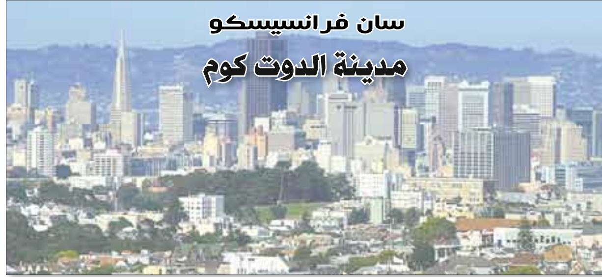
منظر عام لسان فرانسيسكو

وفي الثمانينات ارتفع عدد المشردين في المدينة، ولا تزال هذه مشكلة فيها. وفي التسعينات أصبحت المدينة مركزاً للأعمال الإلكترونية وسميت ب «دوت كوم»، لكن فشلت كثير من هذه الأعمال بانتهائها هذا العصر في 2001. وسان فرانسيسكو هي المركز المالي والبنكي لشاطئ الولايات المتحدة الغربي، فيها بورصة المحيط الهادئ ومركز بنك ويلز فارغو، كما فيها مركز شركة ليفي ستراوس للسرال وماكروميديا للبرامج وبكتل الإنشاء الهندسي والمحيط الهادئ.