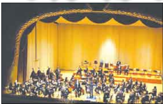
مهرجان أبوظبي الخامس للموسيقى