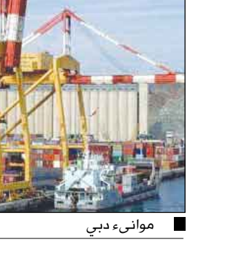
موانئ دبي بي