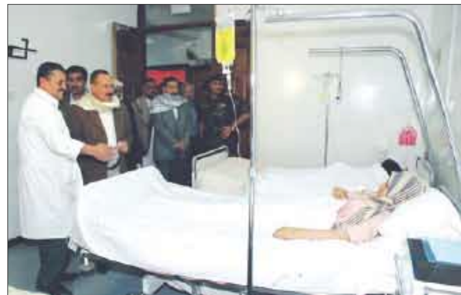
رئيس الجمهورية لدى تفقده المصابين في الحادث