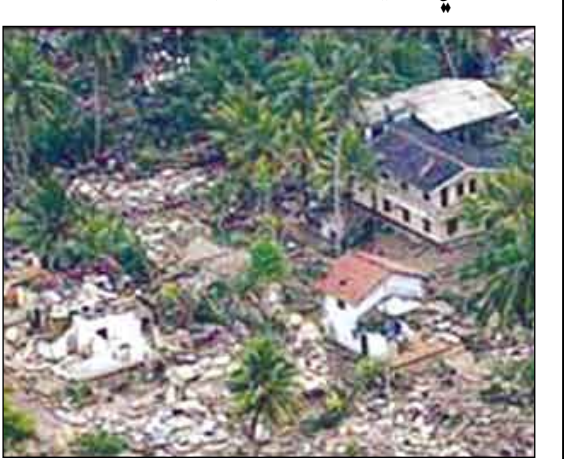
أضرار زلزالية في الصين

زلزال في الصين تلحق أضراراً بأكثر من 2000 منزل