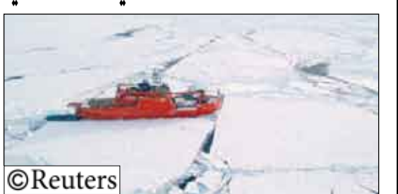
صورة غير مؤرخة للسفينة الأسترالية أوروبو أستريل غرب القارة القطبية الجنوبية

رحلة علمية لتحديد أسباب التغير المناخي بالقطب الجنوبي