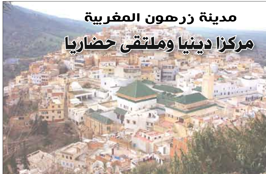
مدينة زرهون المغربية

تحتل اسم «ساحة بئر انزران» نسبة إلى المعركة الشهيرة، التي خاضها الجيش المغربي في الصحراء، حيث تعد منتفسا للسكان الذين يجتمعون فيها كل مساء، وتحيط بالساحة المقاهي العصرية والتقليدية، والمطاعم الشعبية، والكافياتن القريبة من مرقد إدريس الأكبر من كل جانب،