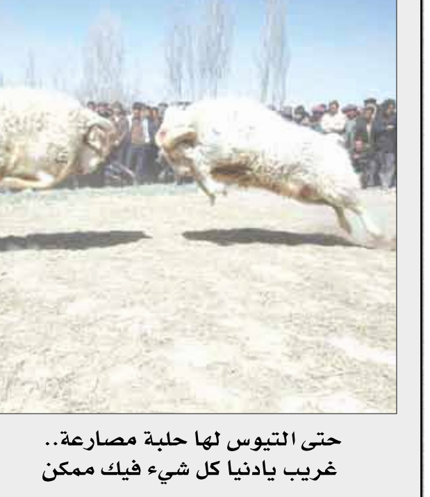
حتى التيوس لها حلبة مصارعة.. غريب يادنيا كل شيء فيك ممكن جاليليو

ونقلت شبكة CNN نقلا عن مصادر عسكرية أن الإجراءات استلزمتم بعض الوقت للتأكد من أي لئس لم يكن مصابا بداء الصرع أو الشراسة وأنه مؤهل للتعامل مع الإنسان!