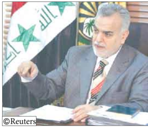
طارق الهاشمي.. نائب الرئيس العراقي

والتي يعتبر الهاشمي احد قيادتها ورفضت هذه الكتل العودة للحكومة حتى الآن.