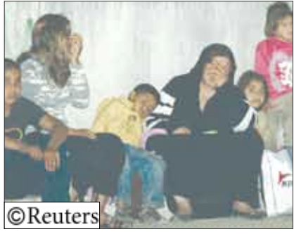
عائلات فلسطينية شردت جراء الاشتباكات بمخيم عين الحلوة

فلسطين المحتلة/14 أكتوبر/رويترز/وكالات: قال مسؤولون إسرائيليون إنه بعد أشهر من التأجيل وافقت روسيا على شراء إسرائيل فيما يتعلق بتسليم مركبات مدرعة لقوات الأمن التابعة لرئيس الفلسطيني محمود عباس.