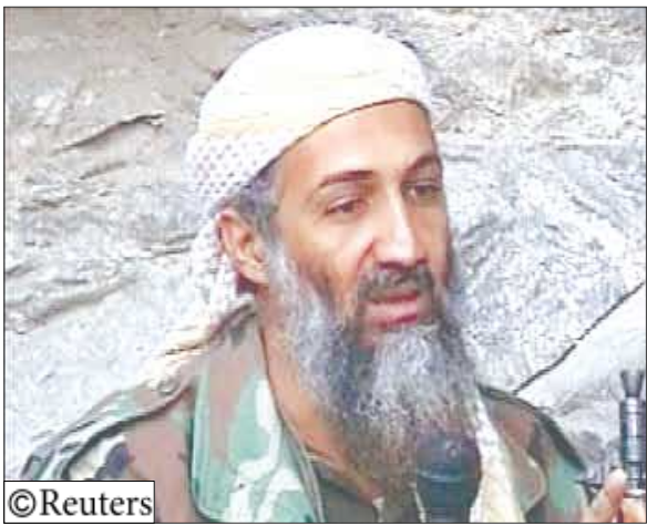
أسامة بن لادن

روما/وكالات: فتحت نيابة روما تحقيقاً حول التهديدات التي قالت إن زعيم تنظيم القاعدة أسامة بن لادن وجهها إلى البابا بنديكت السادس عشر في رسالة صوتية بثها موقع (سايت الأميركي) على الإنترنت، وفقاً لوكالة الأنباء الإيطالية (إنسا).