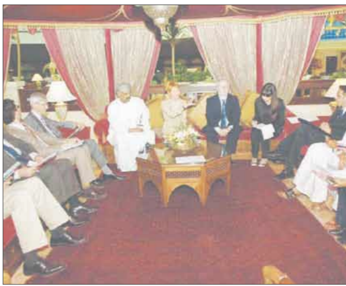
يوسف بن علوي مع وفد البرلمان الأوروبي

استقبل يوسف بن علوي بن عبدالله الوزير المسؤول عن الشؤون الخارجية العماني بمكتبه السيدة ليلى جروبر عضوة البرلمان الأوروبي ورئيسة وفد البرلمان الزائر المرافق لها الذي يزور السلطنة حالياً.