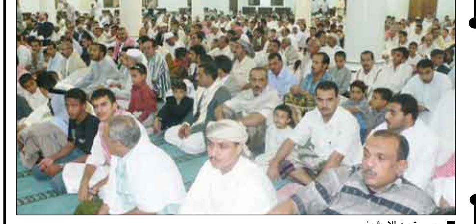
صورة من الإشراف

قال المهندس عمر الكرمي وزير الأشغال العامة والطرق إنه سيتم الانتهاء من جميع الأعمال الإنشائية لقرية الظفير وتسليم أول 100 وحدة سكنية للمستفيدين خلال الأشهر الأربعة المقبلة موضحاً أن نسبة الانجاز الفعلية للمشروع بلغت حتى الآن 70 ٪ من كافة الأعمال الإنشائية إمامة وحدة سكنية يتم تنفيذها حالياً بتوجيهات من فخامة الرئيس علي عبد الله صالح رئيس الجمهورية بتحويل من سمو الأمير الوليد بن طلال. وكان وزير الأشغال العامة والطرق المهندس عمر الكرمي ومعه محافظ محافظة صنعاء علي محمد المقديشي قد تفقدا المشروع للوقوف على طبيعة سير الأعمال الإنشائية للمرحلة الأولى من المشروع. واستمع الوزير والمحافظ إلى شرح مفصل من القائمين على المشروع من مشرفين ومهندسين استعرضوا فيه نسبة الانجاز الفعلية من الأعمال المساحية للموقع وأعمال الحفر وصب الأساسات وأعمال حجر البزلت وحجر الواهجات، وأعمال الدفان الكلية، وصب القواعد الخرسانية والعميد الداخلية والخارجية. وأطلع الكرمي والمقديشي على الفيلد النموذج والتي سيتم الانتهاء من كافة الأعمال الإنشائية بها والتنشيطات النهائية وأبداً ارتباغهم لنسبة الانجاز وكذا الثقة في تنفيذ التصاميم على الواقع. وأشاد الوزير والمحافظ بمستوى الانجاز الذي يلائم كافة المتضررين في الحجم والسعة والشكل والتناسق. وأكد على ضرورة الإسراع في استكمال تنفيذ المباني