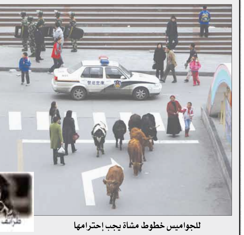
للجواميس خطوط مشاة يجب احترامها