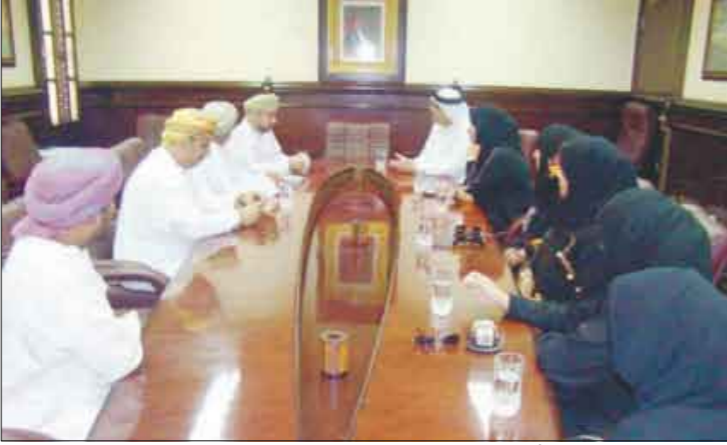
وفد المنظمة العليا أيام الشارقة أثناء زيارته لصحار