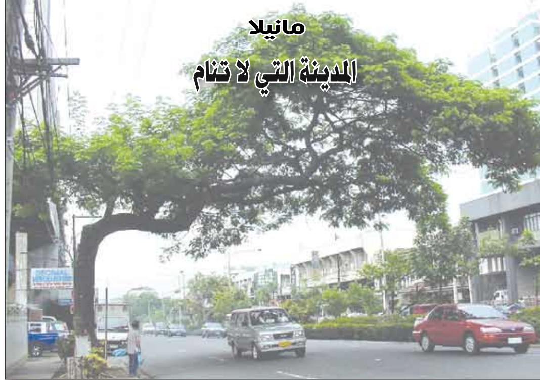
أحد شوارع مانيلاً