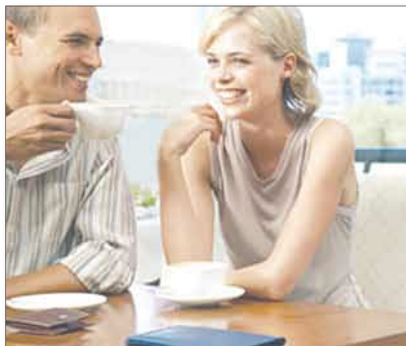
وقالت هولت لنيستاد: «من الليل أكثر عرضة لمشاكل القلب والأوعية الدموية».

□ دكتور / ماريانو : أفادت دراسة أمريكية ان الزواج السعيد يخفض ضغط الدم لدى الرجال والنساء في حين ان الزواج التعيس يرفع ضغط الزوجين. واكتشفت جوليان هولت لنيستاد من جامعة بريغهام يونغ ان ضغط الدم المسجل خلال 24 ساعة لدى الرجال والنساء السعداء في زواجهم كان أقل بأربع درجات منه عند العازبين. وشملت الدراسة مراقبة ضغط دم 204 أشخاص متزوجين و99 شخصاً من العازبين على مدى 24 ساعة.