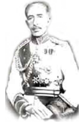
الملك فيصل الأول مؤسس الدولة العراقية الحديثة

ولد في الطائف في 20 ايار 1883م، وترى مع إخوته الثلاثة تكفأ أبوه الشريف حسين ورجاب البادية. اثر خلاف وقع بين أبيه وعمه الشريف عون، انتقل وبقية عائلته إلى اسطنبول وهو في سن الثامنة للإقامة فيها. تدرج بمرحله دراسته باسطنبول. تزوج من الشريفة حزيمة ابنة عمه الشريف ناصر في عام 1905م. عاد إلى الحجاز وبقية أسرته في عام 1909م، اثر تنصيب والده شريفاً على مكة خلفاً لفيصل الشريف عبدالله. اظهر فيصل قيادة تحت لواء والده أثناء قمع الثقل في عسير وبقاى نواحي أهل جدة في اجارة والده ممثلاً عن أهل جدة في مجلس المبعوثين العثماني في تركيا ورحل إلى اسطنبول في عام 1912م. وزار دمشق في عام 1916م، فأقسم بيمين الإخلاص لجمعية «الفتاة العربية السورية المناهضة للوجود العثماني في الجزيرة والشام والتركيا» وكانت بريطانيا تدعم أعمال هذه الجمعية باعتبار أن الدولة العثمانية هي دولة عدوة لها في الحرب العالمية الأولى الناشئة آنذاك. انتدب الجاسوس المشهور لورنس لتفعيل القتال ضد العثمانيين في منطقة الجزيرة والشام وتم لبريطانيا ذلك بقيادة فيصل لما يسمى بالثورة العربية بعد أن ثار أبوه على العثمانيين في 1916 ثم سمي فيصل قائداً عاماً على الجيش العربي وكان معه عدد من الضباط العراقيين الشباب و