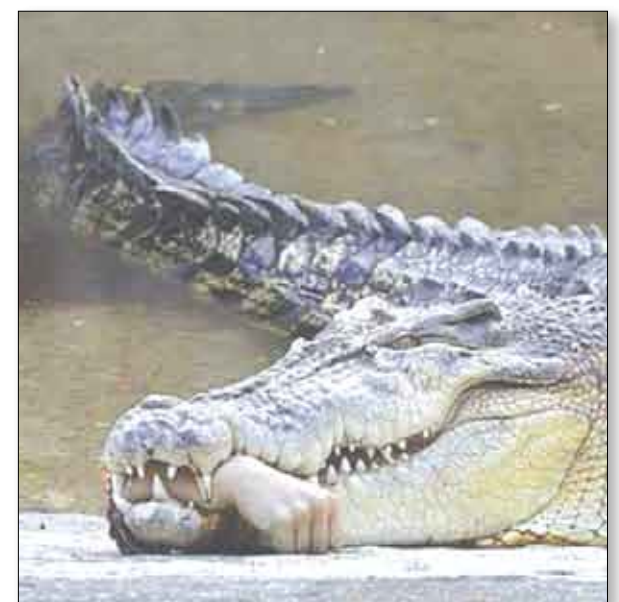
هذه صورة تمساح في حديقة حيوان بجنوب تايوان يحمل بين أسنانه جزءاً من ذراع طبيب البيطري الذي كان يعالجه بعدما قضم ذراعه.