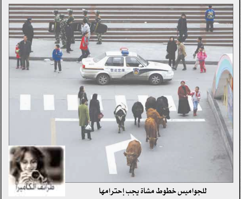
للجواميس خطوط مشاة يجب احترامها