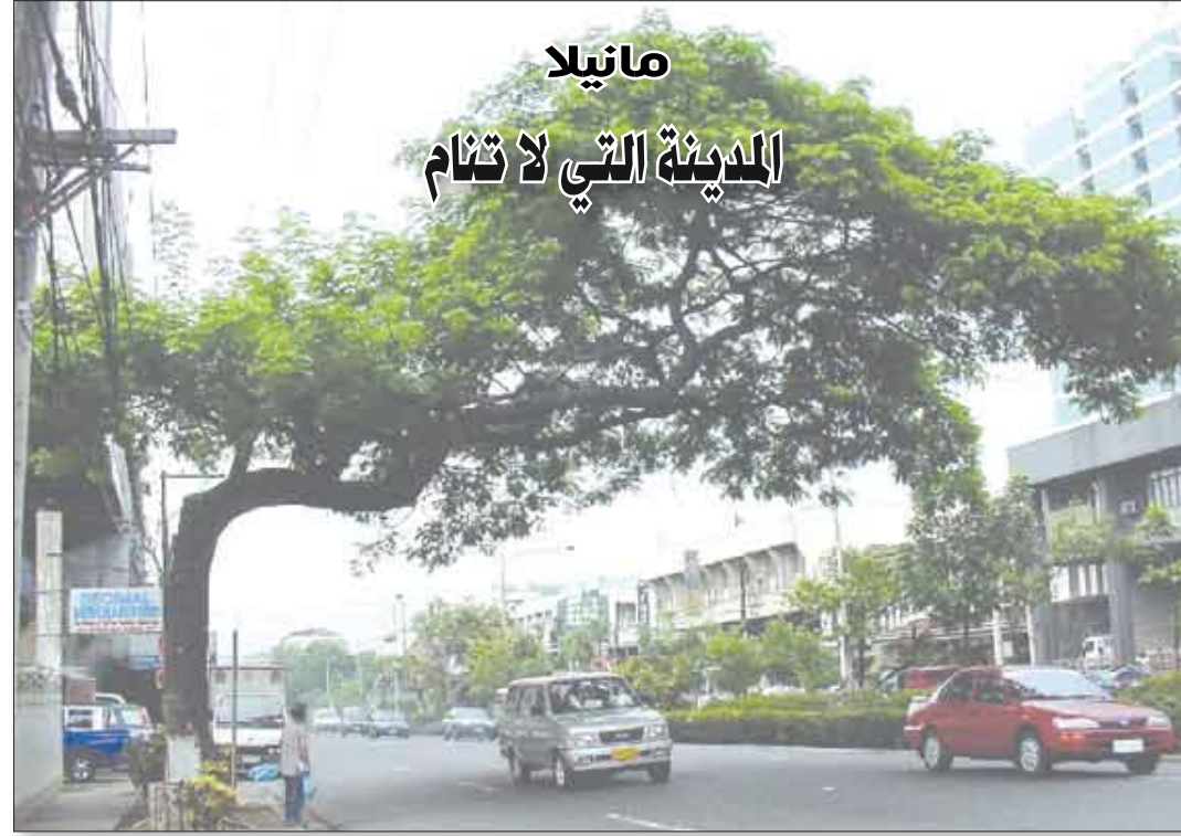
أحد شوارع مانيتلا